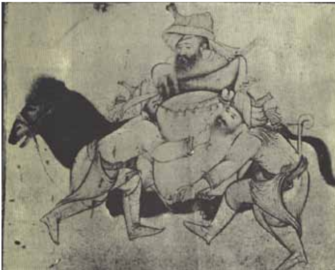
۳ سه مرد باری را بر پشت شتر قرار می دهند (ناشناس)