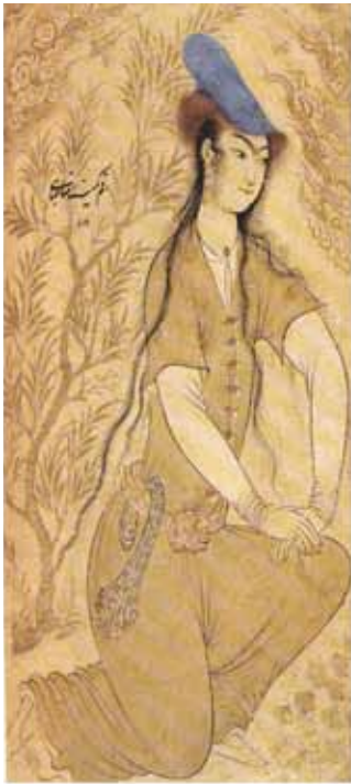
۲۰ رضا عباسی