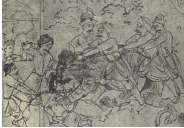
۵ معین مصور