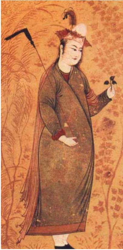
۱۷ افضل الحسينى