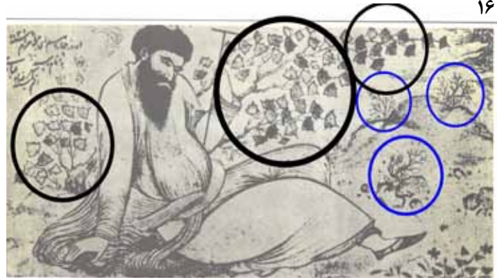
رضا عباسى ۱۶