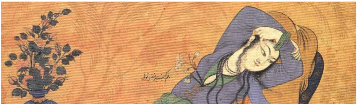
۷ رضا عباسی