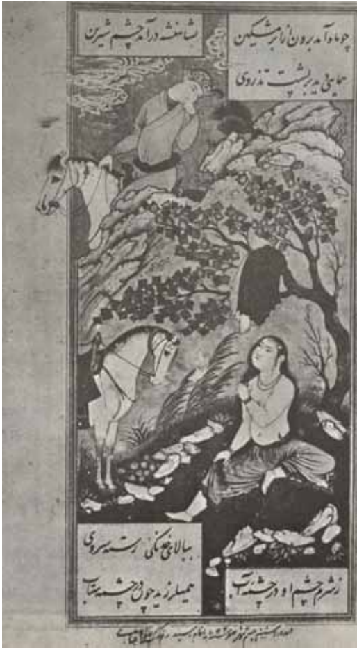
۶ رضا عباسی