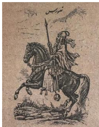
تصویر ۲: تصویر تهمورس در نامه خسروان. سال ۱۲۴۷ ش. (جلال‌الدین میرزا قاجار، ۱۲۸۵ ق: نامشخص)

از نخستین نمونه‌های آثار هنری در نسبت با گفتمان باستان‌گرایی، ابتدا بهتر است به حجاری‌هایی ۸ از فتحعلی‌شاه در چشمه‌علی شهر ری (تصویر ۱) و سپس تنگه واشی فیروزکوه اشاره کرد که تشابه بسیاری با نمونه‌های باستانی آن در انتخاب موضوع، الگوهای زیبایی‌شناسی و غیره دارد. فتحعلی‌شاه که زمان ولیعهدی خود را در شیراز گذرانده بود، با دیدن نقش برجسته‌های دوران باستان در آنجا، بعد از دوازده قرن فراموشی، صخره‌تراشی را سفارش داد و تجدید حیات کرد (تناولی، ۱۳۹۲، صص. ۹۱-۱۰۸)؛ تصمیمی که در نسبت میان گفتمان سلطنتی با جرقه‌های صورت‌بندی گفتمان باستان‌گرایی، قابلیت فهم و تبیین می‌یابد.