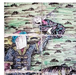
تصویر ۶: کاشی کاری واقعه کربلا (تیر خوردن علی اصغر). تکیه معاون‌الملک کرمانشاه (Fardanews, 2022).