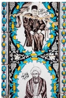
تصویر ۱۴: کاشی کاری با طرح دراویش و صوفیان. تکیه معاون‌الملک (Diyareftab, 2022).