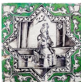
تصویر ۸: کاشی دیواری با طرح کیخسرو. تکیه معاون‌الملک.