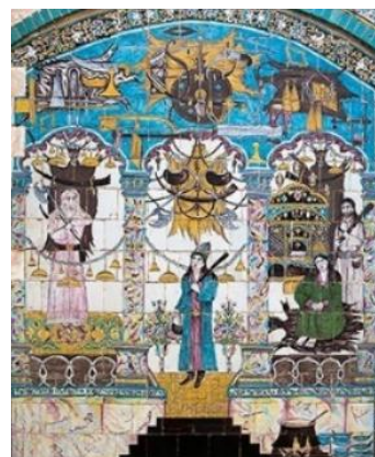
تصویر ۱۵: دو کاشی دیواری چسبیده به هم در تکیه معاون‌الملک با طرح شاهزاده فرمانفرما و حاجی ملاجواد.