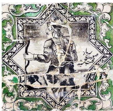
تصویر ۱۷: کاشی دیواری با طرح سرباز تخت جمشید. تکیه معاون‌الملک (Fardanews, 2022).