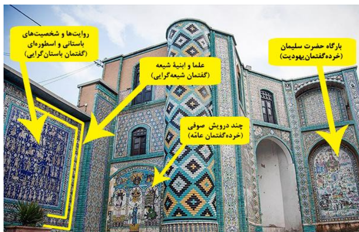
تصویر ۱۶: بخشی از کاشی کاری‌های تکیه معاون‌الملک. نمایانگر فضای گفتمانی این دوره (نگارنده).

افزون بر این‌ها، در اینجا یک سرباز ناشناس عصر باستان (تصویر ۱۷) خود به‌تنهایی موضوع صنایع دستی شده است؛ درحالی‌که تا قبل از این، جایگاه مرکزی تصویر در صنایع دستی فقط برای پادشاهان، شخصیت‌های اسطوره‌ای و تغزلی و مذهبی بود، اما در ذیل