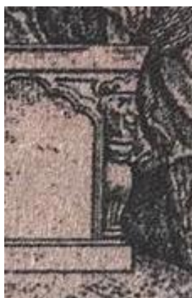
تصویر ۳: راست: تصویر منوچهر در کتاب نامه خسروان. چپ: بزرگ‌نمایی شده همین اثر، تصویر سر شیر حجاری شده. سال ۱۲۴۷ ش. (جلال‌الدین میرزا قاجار، ۱۲۸۵ ق: نامشخص)

چنانچه اشاره شد، نامه خسروان از بنیان‌های دانش گفتمان باستان‌گرایی است. امانت در مورد تصاویر موجود در این کتاب می‌نویسد: «تاج، زیور و جامه پادشاهان با الهام از نقوش سکه‌های ساسانی ساخته شده، ولی نقش‌ونگار زمینه و گاهی تختگاه ایشان از رقم تزئیناتی بود که در کتاب‌های درسی و یا مردم‌پسند اروپایی در سده نوزدهم پیدا می‌شد» (امانت، ۱۳۷۷، ص. ۱۸)؛ یعنی تصویرگر کتاب جلال‌الدین میرزا در ترسیم پادشاه از جلوه‌های هنرهای ایرانی (صنایع‌دستی و غیره) بهره برده، اما در نمایش جایگاه سیاسی وی، از شیوه نمایش غربی استفاده کرده است (تصویر ۲)؛ به عبارت دیگر، باستان‌گرایی در نسبت با هنر، سعی در نمایش هویت ایرانی-باستانی خود به شیوه غرب مدرن (به‌مثابه مخاطب از-پیش-مفروض)، به شکل پذیرفتنی دارد؛ از این‌رو، پادشاه را در هیبتی واقع‌گرا، مبتنی بر کاوش‌های باستان‌شناسان غربی و از روی سکه‌های رونمایی شده توسط غربی‌ها و در مکانی واقعی به‌نحوی به‌نمایش می‌گذارد که پادشاه غربی در نقاشی‌هایشان متداول بود. حضور صنایع‌دستی در اینجا، در قالب عناصری کاربردی (همچون لباس و زره) و هم کارکردی (مثل تاج کیانی و حجاری شیر بر پایه تخت در تصویر ۳) است. همچنین باید گفت، «نامه خسروان، یکی از نخستین تاریخ‌های مصوری است که به‌واسطه چاپ سنگی به میان مردم عادی می‌آید» (دل‌زنده، ۱۳۹۶، ص. ۱۴۰). تصویرهای موجود در این کتاب، بعدها در رسانه‌های مختلف صنایع‌دستی قاجار مکرر بازتولید می‌شود (تصاویر ۴ و ۵) که پژوهش‌هایی مثل (شیرازی و همکاران، ۱۳۹۴) و (بهرامی‌پوران، ۱۳۹۹) به‌طور مفصل بدان پرداخته و مصادیق متعدد آن را ارائه کرده‌اند.