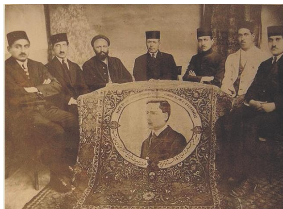
تصویر ۱۹: تصویری از مشروطه خواهان تبریز با قالی موسوم به باسکرویل. سال بافت: ۱۲۸۸-۱۲۸۹ (The Iranian, 2022)