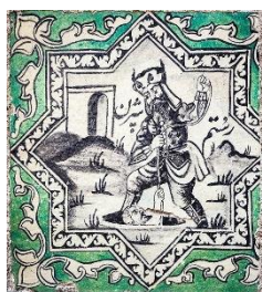
تصویر ۹: کاشی دیواری با طرح بیرون کشیدن بیژن از چاه توسط رستم. تکیه معاون‌الملک (Fardanews, 2022).