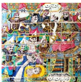
تصویر ۷: کاشی کاری قیام مختار. تکیه معاون‌الملک.