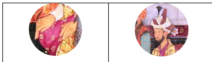
تصویر ۱-۲. همایون (برگرفته از تصویر ۱، توسط نگارنده)

با روی کارآمدن پسرش، همایون، نیز این گونه بی‌توجهی به ساخت زیورآلات ادامه داشته است. مطابق تصویر ۱-۲، همایون، همچون پدرش با دو انگشتری در دستان و زیوری بر دستارش ولیکن بدون رشته‌های مروارید بر آن نشان داده شده است. این بی‌توجهی به زیورآلات، بعدها توسط خود همایون شکل دیگری یافت. یعنی زمانی که وی موفق به بازپس‌گیری حکومت خود شد، در بازگشت از ایران، چند زرگر ماهر ایرانی را همراه با هنرمندانی دیگر با خود به هند برد که این آغاز دوره جدیدی از هنر و صنایع در دربار مغولان محسوب شده است (Ali Sayed, 2015, pp. 3, 10). همچنین، در دوره‌ای که اکبر، پسر همایون بر تخت نشست ساخت زیورآلات هند شکل دیگری به خود گرفت. زیرا از یک سو، وی، سیاست مدارا با سایر ادیان را در پیش گرفته و از سوی دیگر ازدواج با شاهزاده خانم‌های راجپوت ۱۱ در زمان حکمرانی اکبر (Nasir & Kilinc, 2023, p. 865) رایج گردید. لذا می‌توان گفت استفاده بیشتر از زیورآلات در عهد او علاوه بر تأثیرات ایرانی و هندو به نفوذ راجپوت‌ها به دربار وی نیز باز می‌گردد. همان گونه که در تصویر ۱-۳ مشاهده می‌شود اکبرشاه با انواعی از زیورآلات در کنار سایرین جای گرفته است. زیور دستار همراه با مروارید، یاقوت سرخ و زمرد، گردن‌بند دو رشته‌ای مروارید با یاقوت سرخ و زمرد و نیز یک پلاکی در میان رشته‌های مروارید، بازوبند و دستبند مروارید و یاقوت سرخ و همچنین انگشتری‌هایی از این سنگ‌های گرانبها در کنار کمربند و سلاحی جواهرنشان از زیورآلات مورد استفاده وی در این شمایل سلطنتی به شمار می‌آیند.