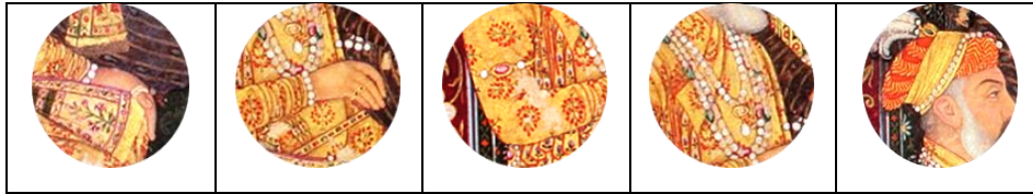
تصویر ۱-۵. شاهجهان (برگرفته از تصویر ۱، توسط نگارنده)