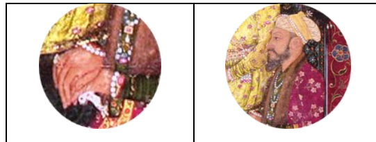
تصویر ۱-۶. اورنگ زیب (برگرفته از تصویر ۱، توسط نگارنده)

ادامه عصر جهانگیر و توجه به شکوه امپراتوری، این بار در زمانه شاهجهان، شدت بیشتری یافته است (تصویر ۱-۵). به طور کلی، در میان امپراتوران مغول برجسته‌ترین آنها، در نمایش ثروت و تجمل، شاهجهان دانسته شده (Asghar, et al., 2003, p. 450) که بیشترین توجه را به انواع زیورآلات و زینت خویش داشته است. در واقع، تمامی زیور مورد استفاده تصویر ۱-۴، به استثنای گوشواره، در تصویر ۱-۵، نیز قابل مشاهده است. نکته مورد توجه در زیور شاهجهان، حضور انگشتری شست کماندار در دست اوست که اگرچه، اولین نمونه آن در دوره مغولان از سنگ یشم و متعلق به جهانگیرشاه بوده (Nigam, 1999, p. 95) لیکن در این شمایل سلطنتی این نوع انگشتری، علاوه بر انگشت دست چپ شاهجهان، بر انگشت دست راست شاهزاده میران‌شاه هم دیده می‌شود. اما، در زمان اورنگ زیب، با وجود محدودیت‌هایی برای ادیان که فقط مسلمانان حق حضور در دربار او را داشتند (Basham, 2011, p. 480)، می‌توان گفت که این امر چندان تأثیری در کاربرد انواع زیورآلات نداشته است. و مطابق تصویر ۱-۶، وی با زیور عمامه، گردن‌بند، دستبند، انگشتری و کمربند و سلاخی جواهرنشان دیده می‌شود. البته زیورآلات اورنگ زیب در اینجا به مراتب ساده‌تر از نمونه‌های سلاطین پیشین یعنی شاهجهان و جهانگیر، است.