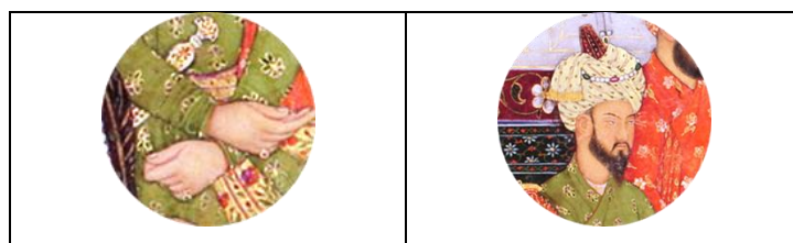
تصویر ۱-۱. بابر (برگرفته از تصویر ۱، توسط نگارنده)

به طور کلی و با استناد به تصویر ۱، مهم‌ترین زیورآلات نزد مغولان از بابر تا اورنگ زیب شامل: زیور دستار، گردن‌بند، انگشتری‌ها، دستبند، بازوبند، گوشواره، کمربند و سلاح‌های جواهرنشان می‌باشد که در ادامه به بررسی جزئیات تصویری هر یک از آنها خواهیم پرداخت. در زمان اولین حاکم و بنیان‌گذار سلسله گورکانی، بابر، ساخت زیورآلات چندان اهمیتی نداشت. وی برخلاف پسران و نوادگانش، بیشتر وقت خود را جهت رزم در چادر سپری می‌کرد (Vaishnavi & Ramya, 2021, p. 18). در واقع با فتح شمال هند، در اوایل قرن شانزدهم، آنها معمولاً طلا و زیورآلاتی را که غنیمت گرفته بودند به درباریان خود می‌بخشیدند و در نتیجه چندان زیوری از سلطنت او باقی نمانده است (Goldenberg, 2015). بنابراین می‌توان گفت، شناخت زیورآلات مغول در عصر بابر اغلب بر اساس شواهد موجود در نقاشی‌های آنها امکان‌پذیر بوده است. لیکن مطابق تصویر ۱-۱، جزئی از تصویر ۱، حضور بابر در کنار سایر مغولان کبیر خالی از زینت نبوده است. زیور دستار به همراه یک رشته مروارید و سنگ‌های گرانبه‌های یاقوت سرخ و زمرد، کمربند و سلاح جواهرنشان، انگشتری یاقوت سرخ در دست راست و زمرد در دست چپ از جمله زیورآلات بابر به شمار می‌آیند.