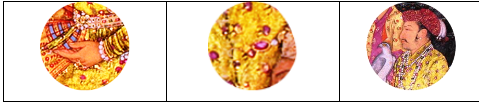
تصویر ۱-۴. جهانگیر