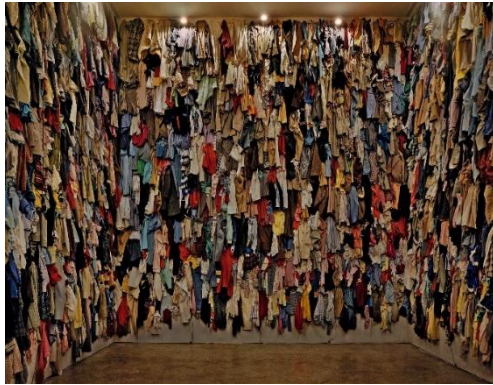
تصویر ۷: کریستین بولتانسکی، ذخیره‌ها: کانادا (۱۹۸۸)، بنیاد هنری یدسا هندلز، تورنتو

بولتانسکی در چیدمان ذخیره‌ها: کانادا ۶۱ (۱۹۸۸) که اولین نسخه از آن در بنیاد هنری یدسا هندلز ۶۴ در تورنتو نمایش داده شد، از