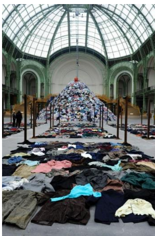
تصویر ۸: کریستین بولتانسکی، سرزمین هیچ‌کس (۲۰۱۰)، جزئیات، اسلحه‌خانه خیابان پارک، نیویورک

آنها یکسان به نظر می‌رسند و ویژگی‌های فردی صاحب لباس، در نگاه مخاطب ناپدید می‌شود. این همان چیزی است که ارنست وان آلفن ۶۵ به آن «اثر هولوکاست» ۶۶ می‌گوید، به معنی «انکار فردیت که به لحاظ ذهنی مثل نوعی مجوز برای نسل‌کشی گروهی مردم عمل