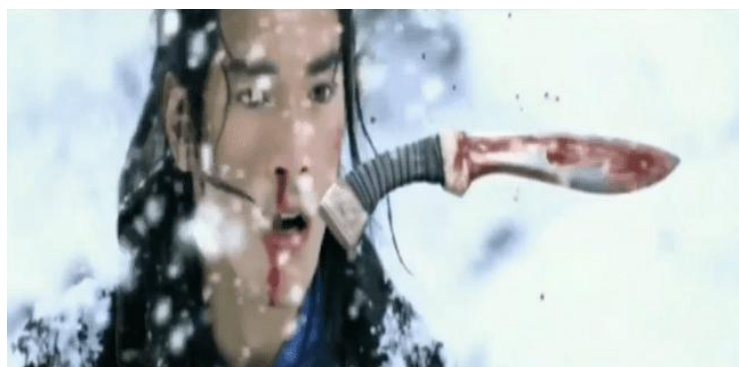
تصویر ۵: سکانس اوج؛ انسداد بین عناصر آب و فلز، خنجرهای پزان، ژانگ ییمو