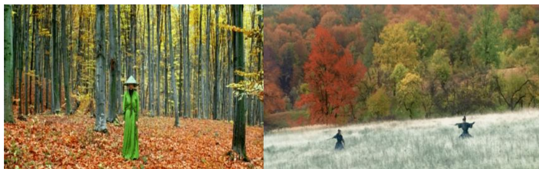
تصویر ۳: میزانسن انقلاب پاییزی؛ خنجرهای پُران، ژانگ ییمو

عنصر مرتبط با آن فلز است و در تقابل با چوب و آتش است. نیروی «بین» (سومی) در سکانس انقلاب پاییزی، به سمت رشد، که به «بین» کوچک معروف است، حرکت می‌کند. در تنظیمات (طراحی صحنه) نور صحنه از روشنایی به سمت تاریکی می‌رود. تغییر رنگ (سبز به زرد) باعث ایجاد اتمسفر صحنه می‌شود. بلاکینگ و صحنه‌پردازی صحنه با خطوط عمودی و خشن «یانگ» هنوز در سکانس خودنمایی کرده و قهرمان زن (سومی) را بر سر دو راهی و اتخاذ تصمیمی سخت قرار داده است.