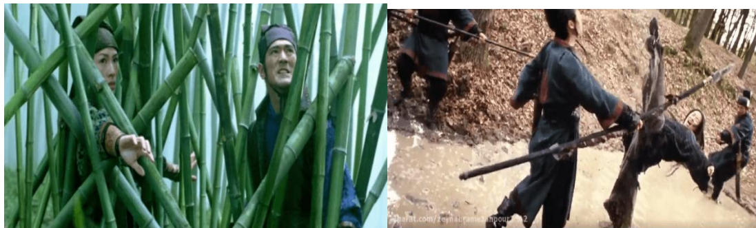
تصویر ۴: توالی فصل‌ها؛ خنجرهای پزان، ژانگ ییمو

برای نخستین بار در یک فیلم شمشیرزنی، انبوه قابل توجهی از تصاویر در کاجستانی نزدیک لویو، در اوکراین، فیلمبرداری شده است. رنگ‌های روشن و ملایم این کاجستان و رنگ‌های پاییزی نیوانگلدنی‌اش به نحوی به یادماندنی با جلوه‌های سبز بامبو، (تصویر ۴) که در یونگ چوان، واقع در جنوب غربی چین فیلم‌برداری شده بود، کنتراست دارد (الی، ۱۳۹۹).