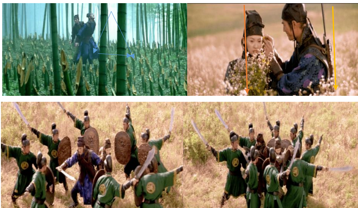
تصویر ۱: میزانشن انقلاب بهاری؛ خنجرهای پزان، ژانگ یمو

شکوفایی عاشقانه پیش می‌روند. «جین» با شخصیت سرباز هوس‌باز، به یک عاشق پروانه‌ای تبدیل می‌شود. از سویی، قلب «سومی» کم‌کم ارتعاشات عاطفی جین را پذیرا می‌شود. در مسیر انقلاب بهاری (تصویر ۱)، «چوب» در هر سکانسی خود نمایی می‌کند. اگر انسان را از خاک بدانیم، آنگاه حضور چوب و خاک را، که متضادند، در مسیر بهاری به شکل درگیری و مبارزه مداوم شاهدیم. «بلاکینگ» سکانس انقلاب بهاری، نیروی جوانی در حال فوران است. در نتیجه، صحنه‌ها پرتحرک، کات‌ها کوتاه است و زاویه دوربین از بالا به پایین، یا از پایین به بالا تغییر می‌کند. افزون بر این، دوربین نیز اسپر نیروی سرکش «بانگ»، دائم در حرکت است.