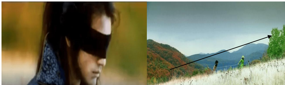
تصویر ۲: میزانسن انقلاب تابستانی؛ خنجرهای پُران، ژانگ ییمو

جمع شده و باعث ایجاد مریضی می‌شوند. در اینجا، رابطهٔ سومی و جین به گونه‌ای بیماری دچار شده و باید طبق پیام فیلم در سکانس‌های دیگر سم‌زدایی گردد (تصویر ۲).