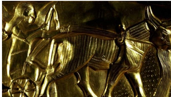
نمایی از فیلم جام حسنلو (اصلانی، ۱۳۴۶)

همان‌گونه که در آغاز بحث اشاره شد، مفهوم «دیدن»، دیدنی ورای ظاهر، را باید از مهم‌ترین عناصر جهان‌روایی و معنایی فیلم‌های اصلانی به حساب آورد. او در آثارش به نحوی از اشیا/ابژه‌ها کارکردزدایی می‌کند تا به فهم تازه و دیدی گسترده‌تر از آن شیء برسد. اصلانی تمایل دارد از وجه کلیشه‌ای شیء عبور کند تا به تعبیری آن را از نیستی نجات دهد. روایت‌های نامتعارف آثارش با زمان‌های غیرگاه‌شمارانه در مسیرشان، هر چه پیش می‌روند اشیا به نااشیا (جام باستانی حسنلو) و شخصیت‌ها، مکان‌ها و شهرها نیز به غیر خود (مثلاً شخصیت‌ها و قلعه در آتش سبز و شهر در تهران) تبدیل می‌شوند. بدین سیاق که در جام حسنلو از تفاسیر نقوش روی جام-شورش خدای آسمان بر گروهی از خدایان-مدارها و لایه‌های دیگری نظیر مقابله حلاج با فقها و خلیفه زمانه را شکل می‌دهد.