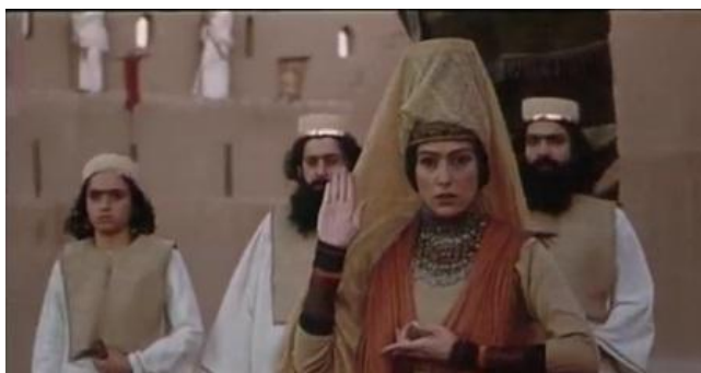
آتش سبز (اصلانی، ۱۳۸۶)

سینماییِ اصلانی، پیوندهای تازه‌ای با وضعیت‌ها و وقایع گذشته خود برقرار می‌گردد. در این سامان جدید و کشف روابط پنهان میان وضعیت‌ها، بیننده می‌تواند به فهم خود از زیست تاریخی غنا بخشد؛ اما همواره در زمان است که به این بصیرت می‌رسد. بی قدرت زمان، زندگی به گفته دلوژ در اکنونی تغییرناپذیر و منجمد و در تکرار این همان اندیشه‌های سنگ‌شده خواهدمرد.