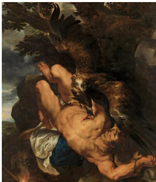
تصویر ۴: پیترو پل روبنس، اسارت پرومته؛ ۱۶۱۸-۱۶۱۲، ارتفاع ۲۴۳/۸ سانتی‌متر.

روبنس، پتر پل (نقاش، رسام، چاپگر و رجل سیاسی فلاندزی، ۱۵۷۷-۱۶۴۰) در تکامل و انتشار سبک باروک با برنینی سهیم بود. نفوذ روبنس جنبه‌ای بین‌المللی داشت و از صمیم قلب در اشتیاق هنرمندان باروک به نمایش شکوه و عظمت، مخصوصاً شکوه و عظمت خاندان‌های سلطنتی - که خود او نیز در میان‌شان چشم به جهان گشوده بود و اعتقادی قلبی به ایشان داشت - شرکت داشت (گاردنر، ۱۳۸۶، صص. ۵۲۱-۵۲۰).