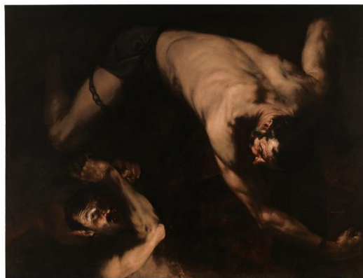
تصویر ۳: خوسه در روبرا، ایکسیون، ۱۶۳۲، تقریباً ۲۲۰ در ۳۰۱ سانتی‌متر، موزه پرادو، مادرید، (منبع تصویر: (Zuffi, 1999, p. 42)

خسه در روبرا (نقاش و چاپگر اسپانیایی، حدود ۱۵۹۰-۱۶۵۲)، که از مهم‌ترین نقاشان باروک اسپانیایی به شمار می‌آید (پاکباز، ۱۳۹۰، ص. ۲۷۸) نیز در نقاشی خود «ایکسیون ۲۵ » (تصویر ۳)، که در سال ۱۶۳۲ به امضای وی رسیده است، صحنه‌ای از اساطیر کلاسیک را نشان می‌دهد، از شکنجه ایکسیون به عنوان مجازات ابدی که توسط زئوس انجام می‌شود. این اثر یکی از مجموعه چهار نقاشی روبرا از چهار «خشم» یا «محکوم» از اساطیر یونان معروف به «لاس فور یاس ۲۶ » است.