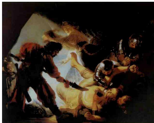
تصویر ۵: رامبراند وان راین، کور کردن سامسون، حدود ۱۶۳۶، ۳۰۲ در ۲۳۶ سانتی‌متر، موزه اشتادل، فرانکفورت.

نخستین نقاشی که نگاه ژرف خویش را متوجه انسان خصوصی ساخت و نقاشی را به وسیله‌ای برای جستجو در حالت روانی انسان، چه در مصورسازی فوق‌العاده شخصی و معتبر متون مقدس به دست خود و چه در چهره‌نگاری انفرادی تبدیل کرد، رامبراند وان راین (۱۶۰۶-۱۶۶۹) هنرمند جوان هلندی و معاصر هالس بود (گاردنر، ۱۳۸۶، ص. ۵۲۵).