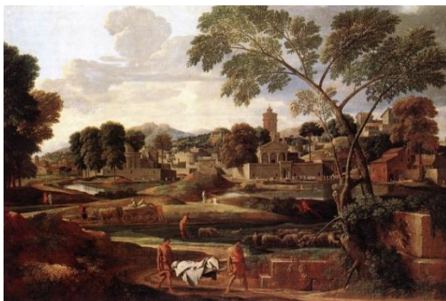
تصویر ۶: نیکولا پوسن، تدفین فوسیون، ۱۶۴۸، تقریباً ۱۱۸ در ۱۷۵ سانتی‌متر، موزه لوور، پاریس (منبع تصویر: گاردنر، ۱۳۸۶، ص. ۵۳۵).

پوسن در یادداشت‌هایی که به نظر می‌رسد برای تکمیل رساله‌ای درباره نقاشی از خود بر جای گذاشته است، «شیوه بزرگ» کلاسیسیسم را مختصراً توضیح داده است. او می‌گوید: هنرمند، در درجه اول باید موضوعات پراهمیت و بزرگ را برگزیند: «... اولین شرط لازم، آن است که داستان و موضوع، بزرگ باشند مانند کارهای قهرمانان، نبردها و موضوعات مذهبی». از پرداختن به جزئیات بی‌اهمیت و موضوعات کوچک، مانند حوادث روزمره زندگی باید خودداری کند: «آنان که موضوعات کوچک را برمی‌گزینند، به علت ضعف استعدادهاشان به این موضوع‌ها پناه می‌برند». پوسن یونانیان باستان را به علت «مدهای ۲۹ موسیقی‌شان می‌ستاید و می‌گوید که آنان به کمک این مدها، نواهای شگفت‌انگیزی می‌آفریدند». او معتقد بود که این واژه، جوهر و چکیده نظرات هنر کلاسیک فرانسه را بیان می‌کند (گاردنر، ۱۳۸۶، ص. ۵۳۴).