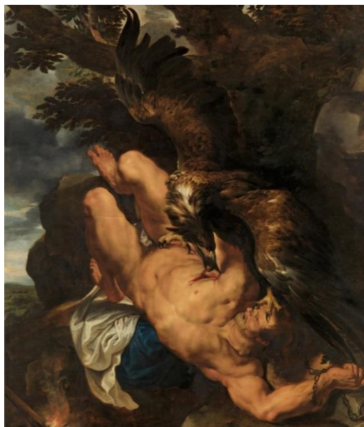
تصویر ۴: پیترو پل روبنس، اسارت پرومته؛ ۱۶۱۸-۱۶۱۲، ارتفاع ۲۴۳/۸ سانتی‌متر.

روبنس، پتر پل (نقاش، رسام، چاپگر و رجل سیاسی فلاندزی، ۱۵۷۷-۱۶۴۰) در تکامل و انتشار سبک باروک با برنینی سهیم بود. نفوذ روبنس جنبه‌ای بین‌المللی داشت و از صمیم قلب در اشتیاق هنرمندان باروک به نمایش شکوه و عظمت، مخصوصاً شکوه و عظمت خاندان‌های سلطنتی - که خود او نیز در میان‌شان چشم به جهان گشوده بود و اعتقادی قلبی به ایشان داشت - شرکت داشت (گاردنر، ۱۳۸۶، صص. ۵۲۱-۵۲۰).