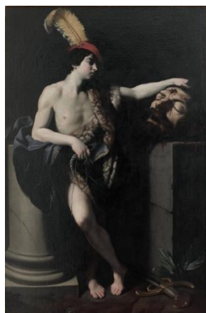
تصویر ۲: گویودو رنی، داوود با سر جالوت، ۱۶۰۵، ۱۴۵ در ۲۲۰ سانتی‌متر، موزه لوور، پاریس، (منبع تصویر: zuffi, 1999, p. 85)

گویودو رنی (نقاش ایتالیایی ۱۵۷۵-۱۶۴۲) از نقاشان ملهم مکتب بلونیایی به شمار می‌آید. رنی در ترکیب‌بندی، رنگ‌پردازی و طراحی به استادی رسید و نوعی کلاسیک‌گرایی التقاطی را در دوران باروک رواج داد (پاکباز، ۱۳۹۰، ص. ۲۶۹).