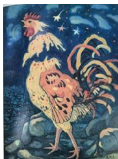
تصویر ۲. آواز خروس، اثر عبدالله عامری، ۱۳۳۰ (منبع: مجابی، ۱۳۷۶، ص. ۲۰۸)