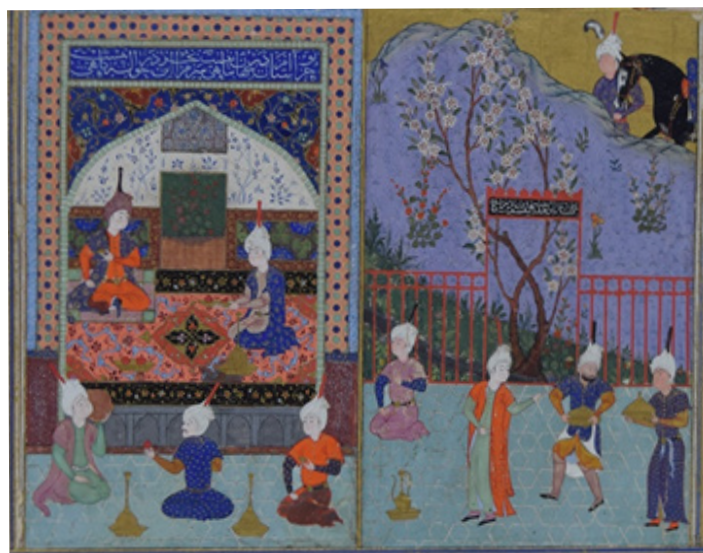
تصویر ۳. گفت‌وگوی شاه‌تیماسب با یکی از درباریان، قرن نهم هجری، ابعاد: ۹۰×۱۴۰

مربوط است که وظیفه خود را نه فقط حاکمیت سیاسی، بلکه، هم‌زمان، ترویج مذهب تشیع و پاسداری از آن می‌دانستند (قمی، ۱۳۸۳، ج ۱: ۴۹).