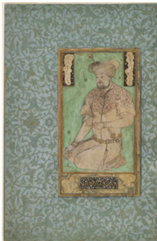
تصویر ۱. صورت سلطان حسین میرزا، منسوب به بهزاد، موزه کمبریج، دست‌نوشته‌ها، موزه‌های دانشگاه هاروارد، آرثر م. ساکлер

در وجه قدرت، نقاشی ایرانی، که اغلب از ادبیات الهام گرفته است، به واسطه هنرپروری متمرکز، شاه اهمیت محوری دارد و هدف نقاش نمایش شوکت شاهانه