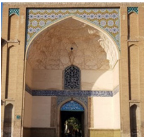
تصویر ۴. سردر عمارت عالی قاپو، قرن دهم، (عکس از نگارنده)