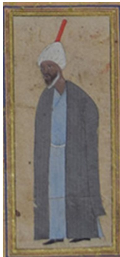
تصویر ۶. احتمالاً از روحانی دربار، تک‌برگ برگه ۱۶۶

درباره تکلتوخان، سام‌میرزا، صاحب تذکره تحفه سامی، از شخصی به نام مولانا زین‌العابدین، مشهور به تکلتوخان، که اصلاً اهل شیراز است، یاد کرده و گفته بلاغت آثارش زبانزد همگان بوده، اوقاتش را به سفر و معرکه‌گیری می‌گذرانده، و سرانجام به خدمت صاحبقران