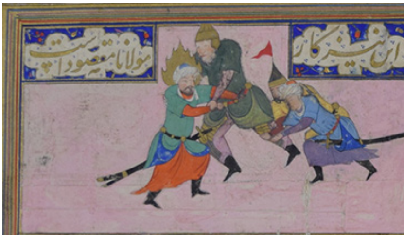
تصویر ۹. صحنه نبرد، نقاش: مولانا مقصود، (۹۷۱ق، ابعاد: ۶۸×۱۳۰ میلی‌متر، مرقع بهرام‌میرزا: برگه ۱۳۱ر

مذهبی دارد. مجموعه این صحنه در زمینه‌ای صورتی‌رنگ، که احتمالاً در زمان تدوین مرقع اضافه شده، قرار گرفته است. پای‌پوش‌های مشکی و شمشیر و کمر بند در دو محور مورب، نوعی حرکت و جنبش به تصویر می‌بخشد. در دو سوی بالای نگاره، دو کتیبه به خط نستعلیق درشت و طلایی‌رنگ (در زمینه‌ای لاجوردی، به همراه نقوش گل‌های الوان) به چشم می‌آید که عبارت «این نیز کار مولانا مقصود است» را به دو بخش می‌کند. چنان‌که این کتیبه تصریح کرده، این نگاره اثر مولانا مقصود است. کریم‌زاده تبریزی درباره مقصود می‌گوید که او از شاگردان بهزاد است؛ در مجلس آرای و تصویرگری مهارت داشته؛ در چهره‌پردازی و منظره‌سازی پر استعداد بوده؛ و در اوایل قرن دهم هجری فعالیت هنری داشته است (کریم‌زاده تبریزی، ۱۳۷۰، ج ۳، ۱۲۰۱).