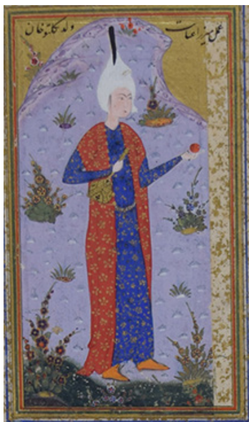
تصویر ۸. ولد تگلتنو [؟] خان، تکبرگ ۳، تک‌نگاره ۲، نگارگر: میرزاعنایت، ابعاد: ۶۰×۱۲۱ میلی‌متر، مرقع بهرام‌میرزا: برگ ۷