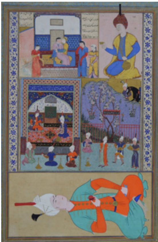
تصویر ۲. برگه ۸۷ پ. قرن دهم هجری، مرقع بهرام میرزا

به صورت عام بوده است. «حضور همزمان هنرپروری و هنردوستی در سایه قدرت از یک سو، و ستیزه جویی و میل به قلمروگشایی از سوی دیگر، این ویژگی به بارزترین شکل حوزه ارزش‌ها و واقعیت را به نمایش می‌گذارد» (اخگر، ۱۳۹۱: ۲۱۷). زبان بیان این نقاشی‌ها از شخص اول حکومت، وجه قدرت را در خصیصه تفسیری به نمایش می‌گذارد. باید در نظر داشت که نمایش جایگاه و قدرت شاه، قبل از تک‌نگاری‌ها، با شکوه و جلال فضای معماری، تزئینات غنی دیوارنگاری‌ها، و حضور ملازمان و خدمت‌وحشم در پیوند بود. در غالب این نوع نمایش‌ها بنا و معماری تصویر نیز تا حد زیادی قابل‌شناسایی است (فغفوری؛ بلخاری‌قهی، ۱۳۹۴).