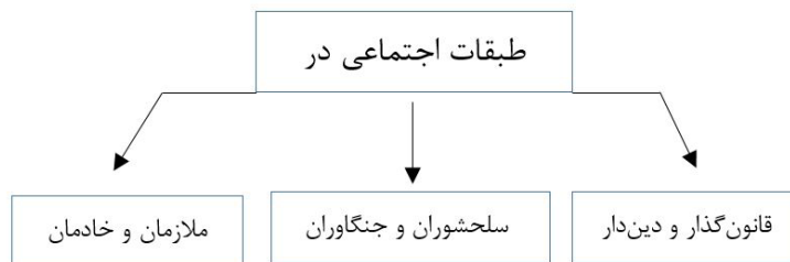
نمودار ۲. طبقات گونه اجتماعی در مرقع بهرام‌میرزا

روایت تصویری می‌آمدند» (پاکباز، ۱۳۸۰: ۸). در رویکرد واقع‌گرایانه نسل جدید جایی برای نمایش انسان و زندگی روزمره گشوده شد. واقع‌گرایی در نقاشی، مانند آموزه یا نظریه‌ای هدفمند، جدا از کیفیات زیبایی‌شناختی، تفسیری از انسان و زندگی اجتماعی و تجسم سیمای زمانه بود که هیچ‌گاه از جهان‌نگری ایرانی - یعنی غلبه مفاهیم و درون‌مایه‌ها - دور نشد.