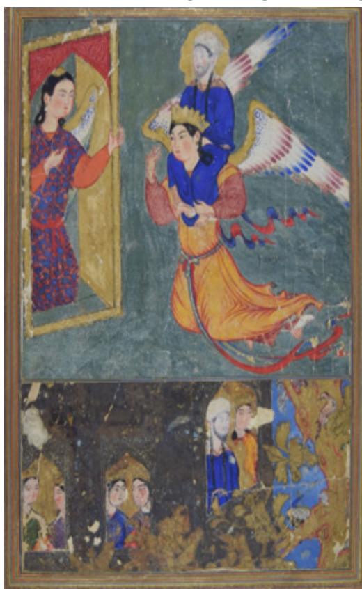
تصویر ۵. معراج پیامبر: احمد موسی، قرن هشتم هجری. رنگدانه مات و طلا بر روی کاغذ، ابعاد: ۲۳۵×۲۳۰ میلی‌متر. مرقع بهرام‌میرزا؛ برگ ۶۱

مربوط است که وظیفه خود را نه فقط حاکمیت سیاسی، بلکه، هم‌زمان، ترویج مذهب تشیع و پاسداری از آن می‌دانستند (قمی، ۱۳۸۳، ج ۱: ۴۹).