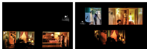
عکس ۳. دو قاب از نمای کلی صحنه از زاویه دید تماشاگران.

متوجه می‌شویم که راه‌های بی‌ربط متصل به یکدیگر از طریق راهرو که منطق جغرافیایی را زیر سؤال برده، کابوس‌وارگی و روان‌پریشی فضا را تشدید می‌کند. فرم در روایت و تصاویری که شرح داده می‌شود، نقش بسیار مهمی دارد. از این لحاظ شاید بتوان اثر مساوات را با نظریه شیون در باب آثار هیچکاک تطبیق داد که معتقد بود پیام بلاواسطه خود فرم است (chion, 1988: 21). در