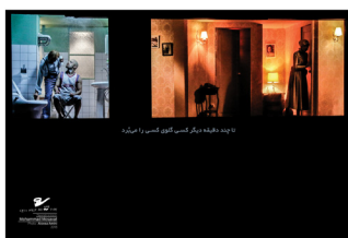
عکس ۱. کارکرد تایتل در این قاب مشخص است.

جنایت اتفاق افتاده و مدرک آن را تنها اشخاص خیالی نمایش‌نامه (پلیس، مامی و احتمالاً ماریا) می‌بینند. چون این جنایت در ساحت نمادین رخ نداده است. گواه جنایت تایتل است. تایتل نقش نگاه ناظر را بر عهده دارد. یک جور دانای کل که گاه پیشگویی می‌کند، گاه آنچه می‌نگریم را نقض می‌کند و گاه در هیئت شخصیت‌هایی که نمی‌بینیم، غیابشان را به حضور بدل می‌کند (همان: ۵). تایتل را می‌توان همان دیگری بزرگ نمایش‌نامه خواند. کسی که امر واقع را برای ما تبدیل به امر نمادین می‌کند و فانتزی را به حقیقت مبدل می‌سازد. تایتل از مهم‌ترین کارکرد دیگری بزرگ یعنی زبان استفاده می‌کند. او دیالوگ ماریا را ترجمه کرده و رفتار او را در جاهایی که خارج از دید ماست، تعریف می‌کند، ۲۰ همچنین رفتار و ورود و خروج مامی و پلیس را شرح می‌دهد و ابعاد خیالی داستان را برای ما تجسم می‌بخشد. او با پیشگویی لحظات حساس، به نوعی نقش گرداننده ماجرا را دارد. به دو نوشته از تایتل که اولی در پرده اول، صحنه یکم و دومی در پرده دوم،