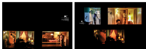
عکس ۳. دو قاب از نمای کلی صحنه از زاویه دید تماشاگران.

متوجه می‌شویم که راه‌های بی‌ربط متصل به یکدیگر از طریق راهرو که منطق جغرافیایی را زیر سؤال برده، کابوس‌وارگی و روان‌پریشی فضا را تشدید می‌کند. فرم در روایت و تصاویری که شرح داده می‌شود، نقش بسیار مهمی دارد. از این لحاظ شاید بتوان اثر مساوات را با نظریه شیون در باب آثار هیچکاک تطبیق داد که معتقد بود پیام بلاواسطه خود فرم است (chion, 1988: 21). در