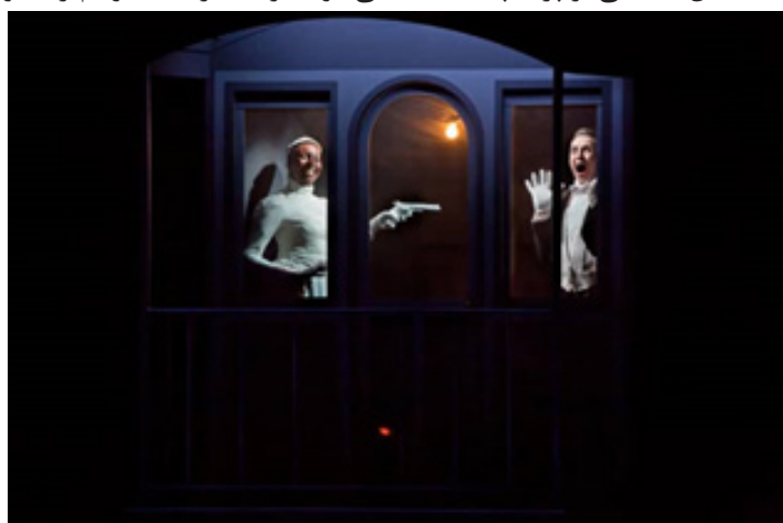
تصویر ۶: اینشتین در ساحل. قطار ۲

اجراگرها در تاریکی در تکاپو هستند. سپس نقاشی ساختمان عظیمی بر پرده پشت دیده می‌شود. مردی در