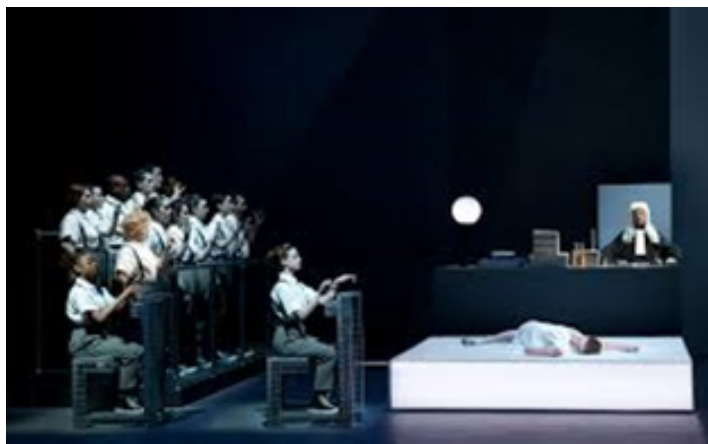
تصویر ۷: اینشتین در ساحل. محاکمه ۲

بنابه نظریه پدیدارشناسی نوربرگ شولتز، مکان معماری زمینه‌ای برای فعالیت‌های انسانی است و فضا به مثابه ظرفیست که وقایع در آن رخ می‌دهد، با کمک عامل زمان تجربه می‌شود و روایتی را بیان می‌کند.