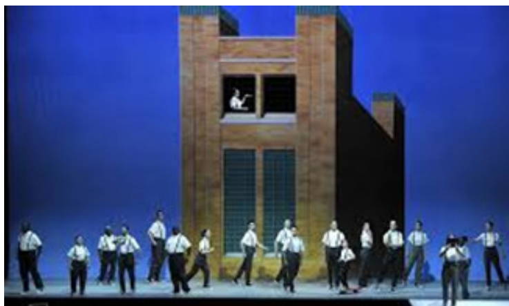
تصویر ۸: اینشتین در ساحل. قطار ۳