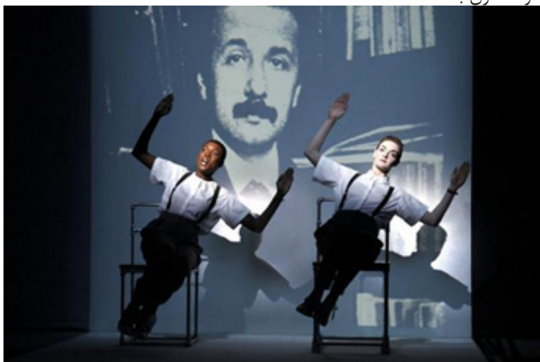
تصویر ۴: اینشتین در ساحل. نمایش‌های رابط ۲

در صحنه قطار دو، پرسپکتیو از جلوبه عقب قطار تغییر کرده و این تخمین را به ذهن متبادر می‌کند که ویلسون روایت تازه‌ای را از تئوری نسبیت اینشتین، تحقق بخشیده است.