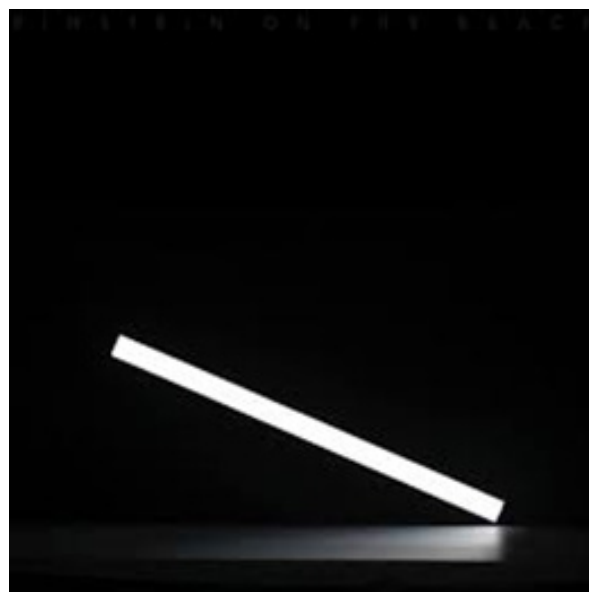
تصویر ۹: اینشتین در ساحل. محاکمه ۳

۷. Tony Hiss نویسنده آمریکایی که نسبت به مرمت شهرها و مناظر آمریکایی پرشور است و در طیف گسترده‌ای از