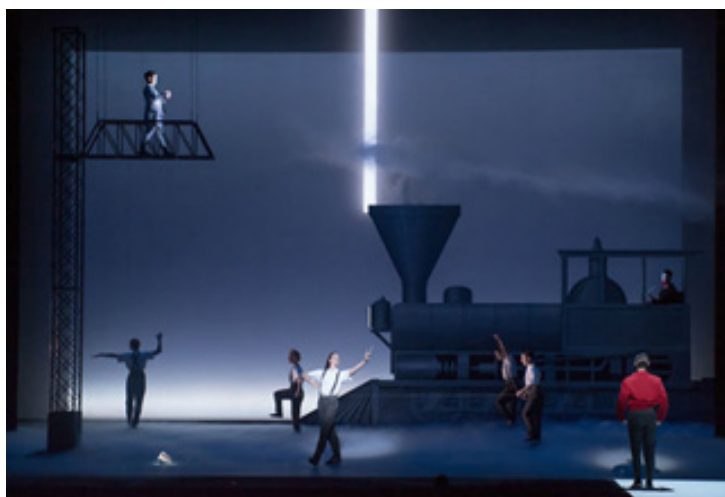
تصویر ۲: اینشتین در ساحل. قطار ۱

صحنه به صورت خیلی کند و در عرض بیست دقیقه صورت می‌پذیرد.