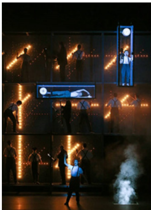
تصویر ۱۰: اینشتین در ساحل. محیط ۳، سفینه‌ی فضایی

مطالعات در اجرای اینشتین در ساحل ویلسون، نشان می‌دهد فرم و محتوای این نمایش با توجه بر مفاهیم مکان و فضا از دیدگاه نوربرگ شولتز، با استفاده از تخیل مخاطب، فضای نمایش را به نمادها و نشانه‌هایی بدل می‌کند که معنای اثر درک و دریافت می‌شود. هر مکان معماری و اجرای تئاتری با توجه به هدف خالق آن، روایتی مختص به خود را دارد و معنای اثر را با