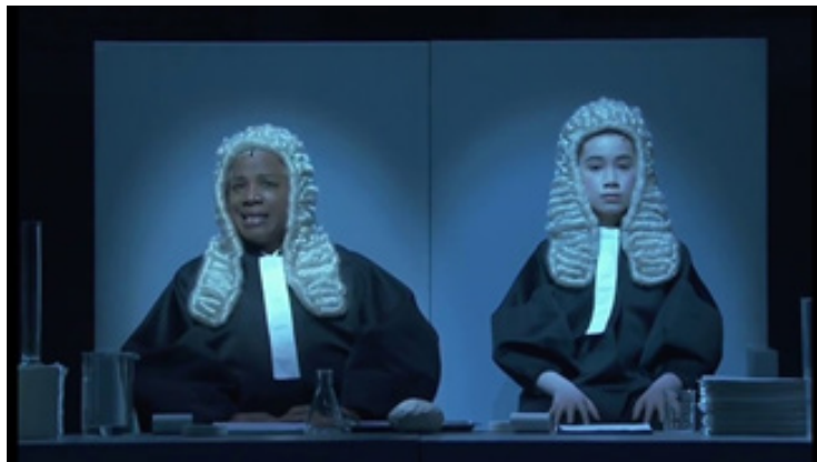
تصویر ۳: اینشتین در ساحل. محاکمه ۱

شکل دیگری از نی پلی یک. دو زن سیاه پوست و سفید پوست عقب صحنه هستند. در همان مربع سفید و روشن‌شان. اما این بار پشت‌شان به تماشاگران است. چهره گروه کر روشن می‌شود. طوری که انگار در نقطه شروع نمایش هستیم.