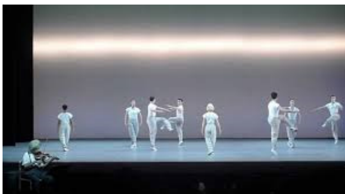
تصویر ۵: اینشتین در ساحل. محیط ۱

یکی از پنجره‌های بالایی آن روی کاغذ چیزی می‌نویسد. بیست و چهار اجراگر در صحنه هستند که اونیفورم اینشتین را بر تن دارند و به سمت روبرو خیره هستند. مرد بیرون می‌رود.