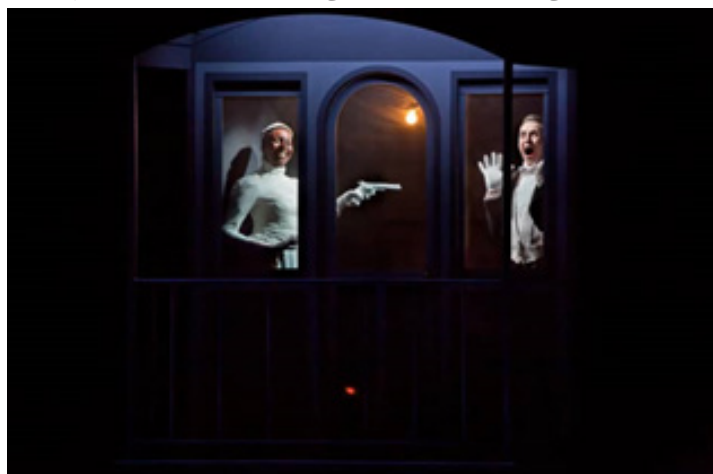
تصویر ۶: اینشتین در ساحل. قطار ۲

اجراگرها در تاریکی در تکاپو هستند. سپس نقاشی ساختمان عظیمی بر پرده پشت دیده می‌شود. مردی در