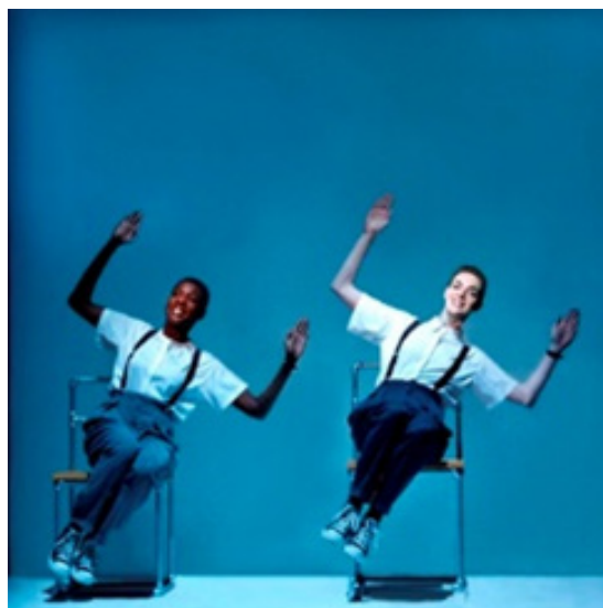
تصویر ۱: اینشتین در ساحل. نمایش‌های رابط ۱

شروع نمایش همراه با ورود تماشاگران اجرا می‌شود. دو زن یکی سیاه‌پوست و دیگری سفیدپوست، پشت میزهای مینی مالیستی، سمت چپ صحنه، داخل نور مربع شکل که بر روی پارچه سفید پشت سر آنها تابیده شده، نشسته‌اند. زن‌ها اعدادی را تصادفی حساب می‌کنند. اعضای گروه کر به آرامی وارد صحنه می‌شوند. نور روی بازیگران متمرکز می‌شود. کنش‌ها در این