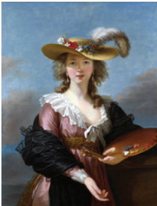
۲ سلف پرتره، مادام ويجی لبرون، ۱۷۸۲م