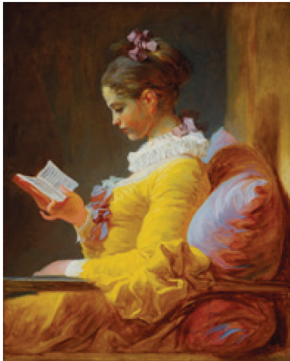
۳ دختري در حال مطالعه، فراگونار، ۱۷۷۶م