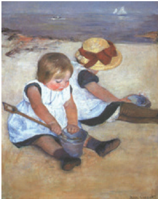
۵ کودکان در ساحل، ماری کاسات، ۱۸۸۴م