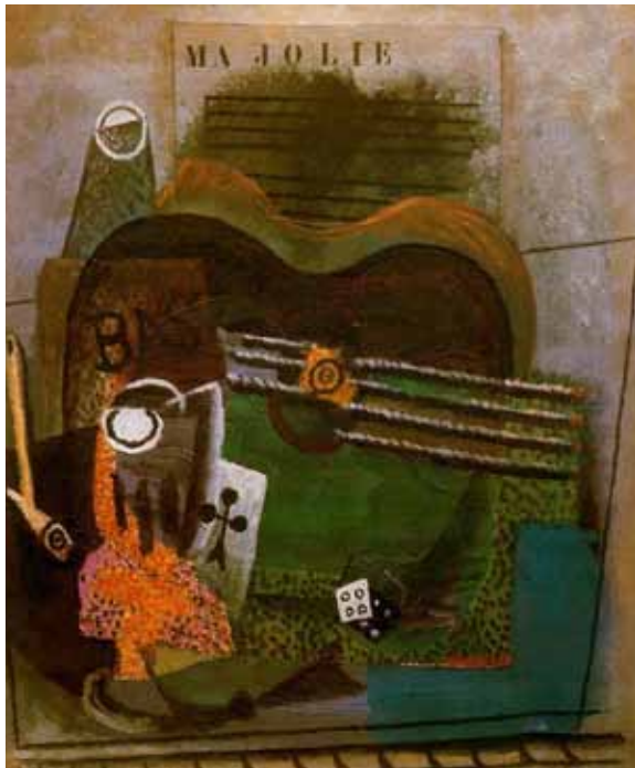
طبیعت زیبای بی جان من