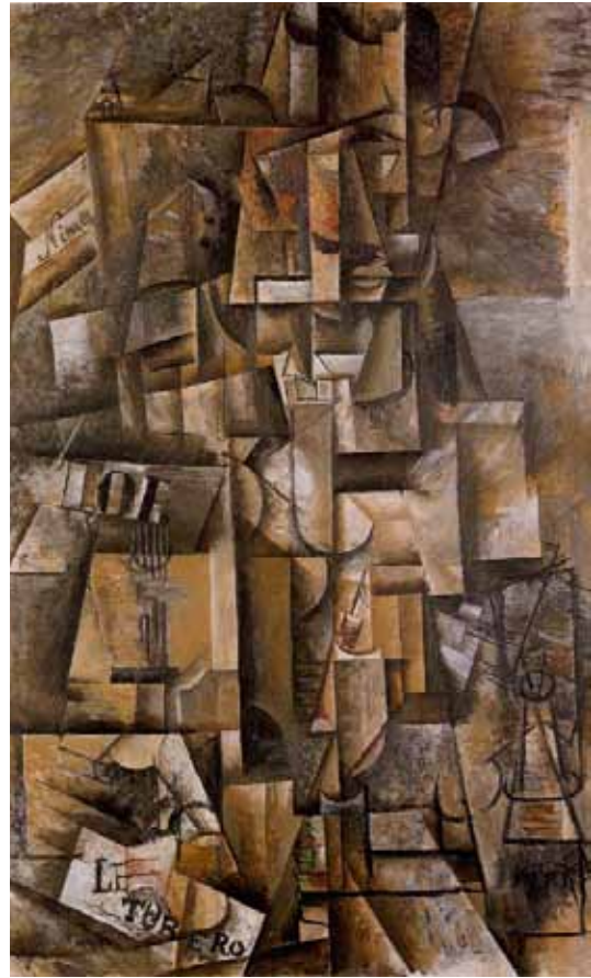
۵ گاو باز