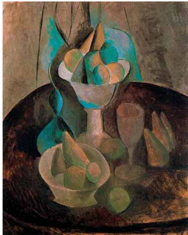
۱۲ طبیعت بی جان ظرف میوه