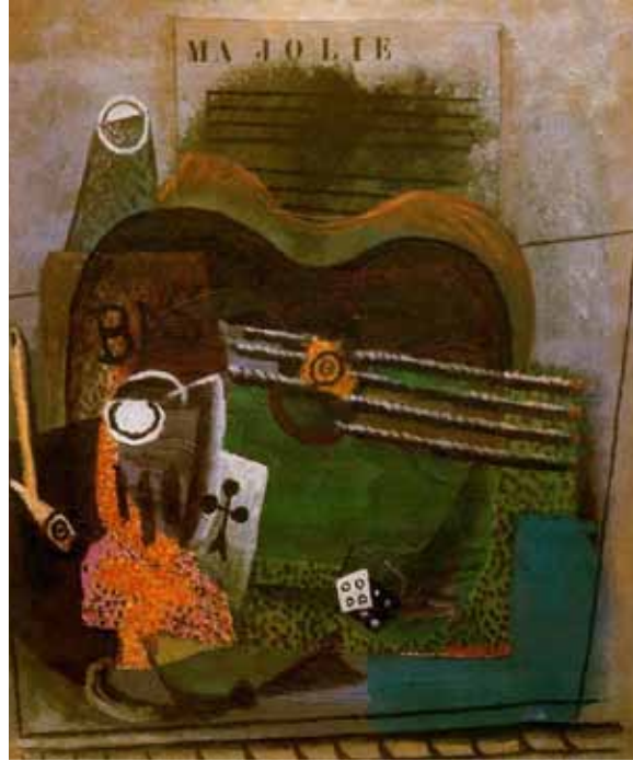
طبیعت زیبای بی جان من