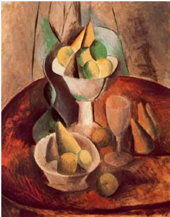
طبیعت بی جان جام‌ها