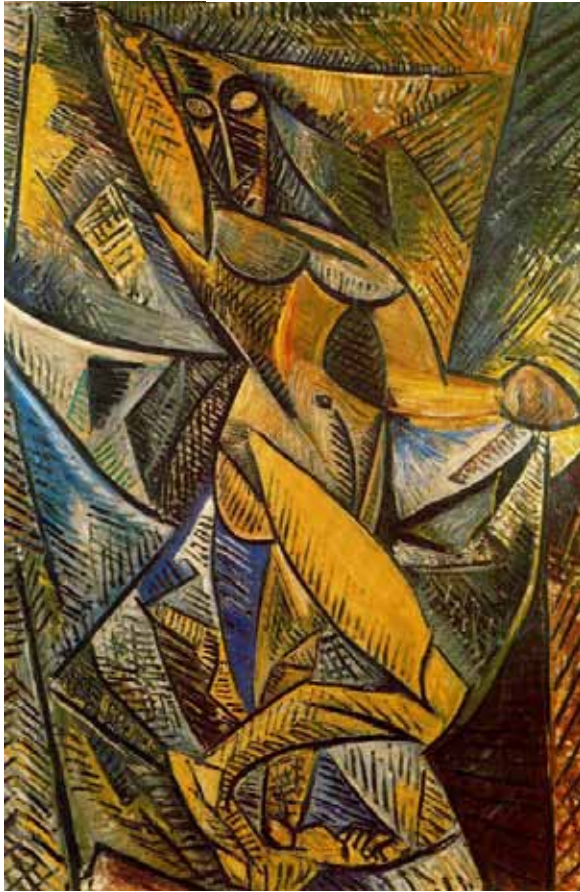
۶ یک زن