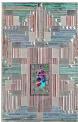
تصویر ۴: ۱۳۵۳ (URL 11)