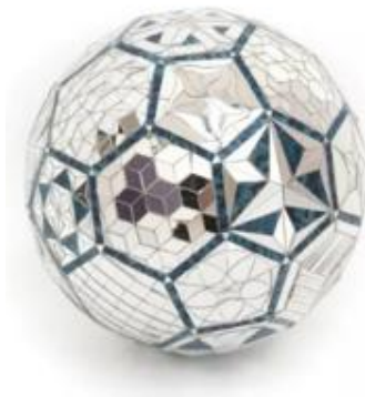
تصویر ۲: ۱۳۸۹ (URL 9)