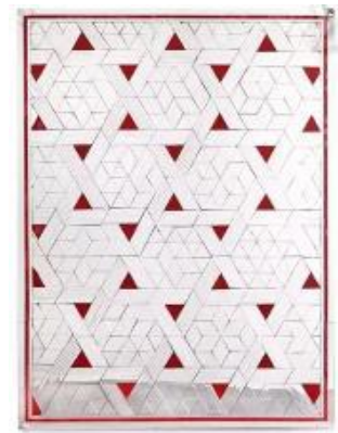
تصویر ۳: توپ آینه، ۱۳۹۱ (URL 10)