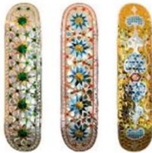
تصویر ۱۹: لیلا نظریان، ۱۴۰۱، آینه‌کاری (URL 26).