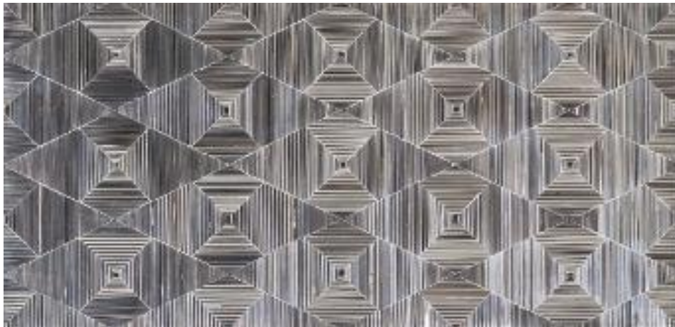
تصویر ۸: دهمین حراج تهران، منیر فرمانفرمایان، شیراز (طراحی با شیشه)، تیر ۱۳۸۸، آینه کاری و گچ روی چوب (URL 16).