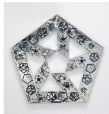
تصویر ۶: پنج ضلعی، ۱۳۹۰ (URL 13)