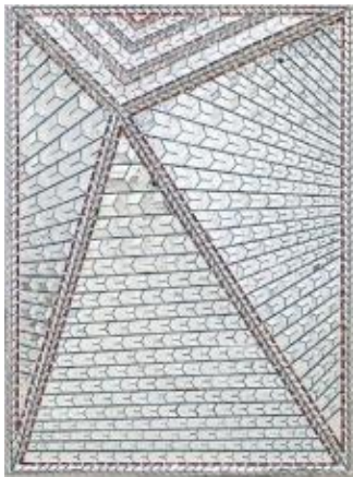
تصویر ۱: تصویر زهرا، ۱۳۸۸ (URL 8)

نیاوران، پانل‌های تزئینی برای اتاق خواب فرح در کاخ نیاوران و یک مجسمه برای باغ‌موزه فرح طراحی کند. فرمانفرمایان در طول دوره فعالیت هنری خود موفق به کسب جوایز معتبر متعددی گشت که از آن جمله می‌توان به مدال طلای بینال ونیز (سه‌بار در سال‌های ۱۳۳۷، ۱۳۴۳ و ۱۳۴۵) و مدال طلای نخستین بینال تهران سال ۱۳۳۷ اشاره کرد. اولین نمایشگاه انفرادی آثارش نیز تقریباً یک سال بعد و در دانشکده هنرهای زیبای تهران برگزار شد. در سال ۱۳۵۶ در پاریس و نیویورک نیز نمایشگاه‌های انفرادی‌اش برگزار گشت، که موجب بیشتر دیده‌شدن او در مجامع هنری بین‌المللی شد (URL 5 & 6) (تصاویر ۱ تا ۶). در پی وقوع انقلاب و در پی مهاجرت وی به آمریکا در سال ۱۳۵۷، حضورش در صحنه‌های هنری کمرنگ شد تا اینکه، برای نخستین بار پس از انقلاب، در سال ۱۳۸۳ (یک سال پس از بازگشت‌اش به ایران) اثر تازه‌ای از این هنرمند با عنوان «آب روشنایی است» در نمایشگاه باغ ایرانی به تماشا درآمد (URL 7).