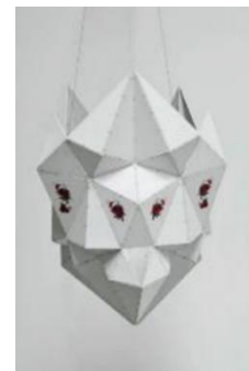
تصویر ۱۴: سهند حسامیان، چینی بندزن، ۱۳۸۷ (URL 21).