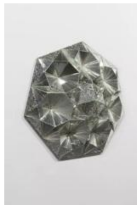
تصویر ۵: خانواده سوم، ۱۳۹۰ (URL 12)