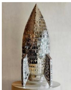
تصویر ۲۵: شایلان عشایری، از مجموعه آپولو، آینه‌کاری روی فایبرگلاس، ۱۴۰۰ (صفحه شخصی هنرمند).