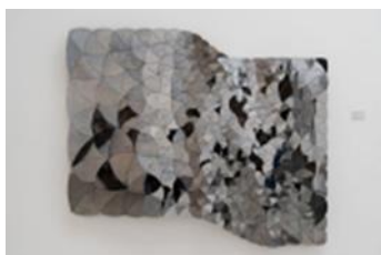
تصویر ۱۵: عارف منتظری، آینه نامیرا ۵، پلکسی‌گلس، آینه، پلیمر (URL 22).