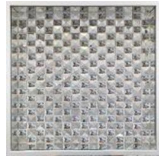
تصویر ۲۰: معصومه ابیرنیا، ۱۳۹۷، گچ، آینه و تمبر (URL 27).