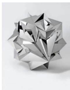
تصویر ۱۶: تیمو ناصری، پارسک ۳، فولاد ضدزنگ (URL 23).