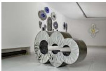
تصویر ۱۲: ماندانا مقدم، از مجموعه سرزمین عجایب، ۱۳۹۳، آهن و آینه‌کاری، گالری آران، تهران (کشمیرشکن، ۱۳۹۶، ص. ۴۵۶)