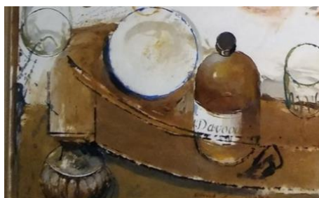
تصویر ۷ - بخشی از اثر

نشانه‌های کلامی در نیمه پایین کادر قرار گرفته‌اند، که برخی جزئی از لایه تصویر به شمار می‌آیند؛ مانند نوشته کوکاکولا روی بطری نوشابه، اسم کوچک نقاش، سال خلق اثر و کلمه دوربین که در کنار تصویر دوربین نوشته شده است. همچنین یادداشت‌هایی پراکنده در کنار لیوان با این مضمون: «استکان نوشیدنی الان خالیه»، «شیر آبه این، چیز مهمی نیست، دیروز که لوله‌کش اومده بود شیر رو عوض کنه یادش رفته اینو از روی میز برداره» که در کنار تصویر شیر آب قدیمی با خودکار نوشته شده است (تصویر ۶). بخشی از یک دفترچه که کنار لاشه شقه‌شده کلاژ شده و همین‌طور عنوان اثر و مجموعه که در قسمت پایین و چپ کادر نوشته شده است. کاغذ کلاژشده‌ای که تقریباً در مرکز قرار دارد و بخشی از لایه نوشتاری اثر به شمار می‌آید، برگه‌ای از دفتر حساب کارخانه‌ای قدیمی است که کارگاه نقاش در آن قرار دارد (مکاتبه با هنرمند، ۱۳۹۹). این مورد خاص صرفاً بر حضور زندگی روزمره هنرمند در قاب تصویر