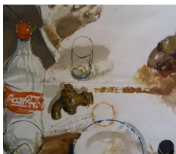
تصویر ۶ - بخشی از اثر

یک صندلی خالی دلالت بر ثبت این خاطرات توسط عکاس دارد که اکنون درون قاب نیست؛ آنچه که این مهمانی را از حالت عادی خارج کرده و به آن جنبه‌ای سوررئال بخشیده، حضور لاشه حیوانی با وضعیت رقت‌بار روی میز پذیرایی است. حضور این لاشه موجب تعجب هیچ‌کدام از حاضران نشده و به نظر می‌رسد که دغدغه‌شان ثبت تصویری مناسب از چهره‌شان درون قاب دوربین یا در ذهن مخاطب است. نگاه کردن مسئله مهمی در این تصویر است و نقاش با گنجاندن ابزار دوربین (عکاسی و شکاری) بر این امر تأکید دارد. حضور دو مرد در پس‌زمینه که هر دو به نقطه‌ای، احتمالاً به نقطه‌ای نه‌چندان نزدیک، نگاه می‌کنند؛ تأکید مضاعفی است بر دیدن و دیده شدنی که گویی مخاطب را در مواجهه با تصویر غافلگیر می‌کند (زاویه نگاه در این تصویر تداعی‌کننده این احساس است که افراد به جایی بیرون از تصویر و احتمالاً به مخاطب خیره شده‌اند، همان‌گونه که مخاطب به تصویر خیره شده است). تمامی عناصر این متن در یک بافت قرار دارند و همگی به هم مرتبط هستند جز عناصری مثل شیر آب که روی میز قرار دارد (تصویر ۶) و البته بطری قهوه‌ای‌رنگ که نام نقاش روی آن آمده (تصویر ۷) و به نظر می‌رسد از ابزار کارگاه نقاشی‌اش باشد که روی میز جا مانده است!