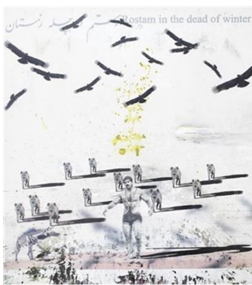
تصویر ۴- از مجموعه رستم در چله زمستان، فریدون آو، ۱۳۸۸، (URL4)

در آثار این هنرمند حضور دارند. رستم در چله زمستان (تصویر ۴) سال ۱۳۸۸ ش. در گالری آران به نمایش درآمد و موزه هنر متروپولیتن در سال ۱۳۹۳ ش. آن را خریداری کرد (URL3). او از جمله هنرمندانی است که عنوان، تاریخ و امضای شخصی اش را به درون تصویر می آورد (آفرین، ۱۳۹۸: ۸۲). رستم در چله زمستان اثری است که با تکنیک و اسلوب ترکیب مواد، چاپ و کلاژ در ابعاد ۱۹۵*۲۱۵ اجرا شده است. عناصر بصری درون قاب که هر کدام می توانند لایه ای در خوانش متن به شمار آیند، عبارت اند از نشانه های شمایی تصویری (کرکس های در حال پرواز، ورزشکار کشتی گیر، کفتارها)؛ نوشته بالای کادر با دو زبان فارسی و انگلیسی؛ ترکیب بندی و در نهایت تکنیک و اسلوب اجرا.