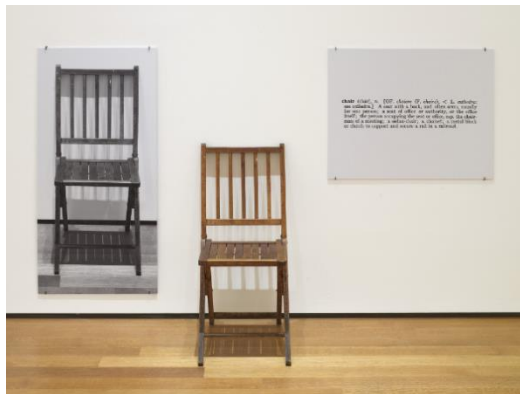
تصویر ۲- جوزف کسوت، یک و سه صندلی، ۱۹۶۵، (URL2)

تصاویر، با توجه به عملکرد ویژه هریک از این رسانه‌ها، فضاهای مفهومی جدیدی ایجاد کردند که معنا در آن‌ها سیال و چندلایه است؛ از این منظر هم‌نشینی کلمات و تصویر می‌تواند اثر هنری را به صحنه دیالوگ دائمی نشانه‌های کلامی و تصویری بدل کند که گاه هم‌آوا و گاه در مقابل هم هستند.