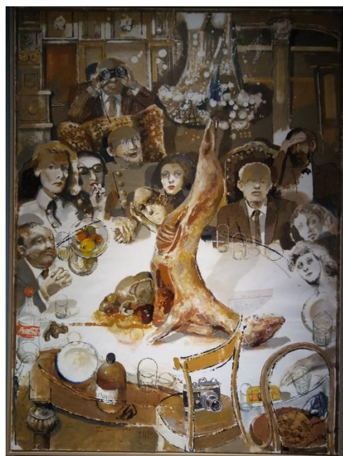
تصویر ۵ - ضیافت، داوود زندیان، ۱۳۹۸ (نگارندگان) (عکاسی از نمایشگاه هنرمند در گالری ایرانشهر)