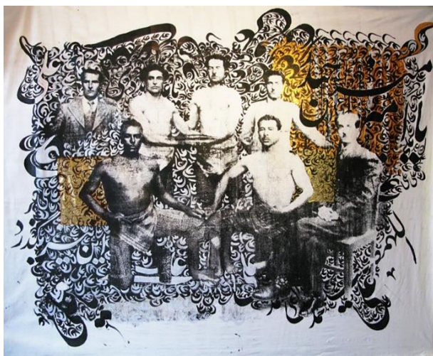
تصویر ۳- ۱۷/۸ از مجموعه یاعلی مدد. خسرو حسن‌زاده. ۱۳۸۷ (نگارندگان) (مجموعه شخصی هنرمند).

با نگاهی به آثار حسن‌زاده موضوعاتی چون زنان، جنگ، قهرمانان، سنت‌های مردمی و اجتماع به چشم می‌آید. حسن‌زاده از جمله هنرمندانی است که رمزگان زبانی حضور پررنگی در آثارش دارد و تقریباً تمامی مجموعه‌های کاری‌اش حامل نشانه‌های نوشتاری هستند. تصویر ۳، اثر شماره ۸ از مجموعه یاعلی مدد مربوط به سال ۱۳۸۷ ش. است که علاوه بر نمایش داخلی، در گالری آرنت پاریس و همچنین در گالری b21 دبی در سال ۲۰۰۸ م. نمایش داده شد. در نگاه نخست تصویر هفت مرد را می‌بینیم که در دو ردیف نشسته و ایستاده بر روی پس‌زمینه‌ای از حروف و کلمات قرار گرفته‌اند و دو لایه اصلی این متن را تشکیل می‌دهند. تکنیک اجرایی هنرمند که چاپ سیلک اسکرین و اکریلیک روی بوم است لایه بعدی اثر و در نهایت ترکیب‌بندی این عناصر در قاب افقی و پسین لایه به شمار می‌آید.