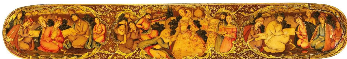
تصویر ۱- آقا نجف اصفهانی، قلمدان با نقش داستان شیخ صنعان و دختر ترسا در مدالیون وسط، دوره قاجار، حراجی کریستیز

نفوذ تصوف یکی از عوامل مهم و تأثیرگذار فرهنگی در بسیاری از نقاشی‌های اسلامی است. در این راستا، جایگاه فرهنگی عرفان سبب دگرگونی در ادبیات و هنرهای بصری از طریق ایجاد نوع خاصی از زبان نمادین شد (همان: ۱۵۴). معمولاً داستان‌های عاشقانه با تفاسیر عرفانی به حوزه نگارگری وارد می‌شده و بدین نحو موضوع تصویرسازی‌های فراوانی شده است. از جمله تصویرگری از داستان شیخ صنعان و دختر ترسا (تصویر ۱) یا لیلی و مجنون، هنوز محبوب نگارگران است. ترسیم شمایل ائمه اطهار و مشایخ صوفیه نیز موضوع مناسبی برای ابراز علایق عقیدتی هنرمندان عارف بوده است. در موسیقی، جدای از تفاسیر عرفانی از ذات موسیقی، اکثر تصانیف مشهور در موسیقی سنتی ایران دارای وجوه عرفانی هستند. باید توجه داشت که فارغ از انتخاب آگاهانه هنرمندان از موضوعات عرفانی به‌عنوان جان‌مایه آثار خود، از آنجا که در قرون متمادی مضامین عرفانی یکی از موضوعات شاخص آثار هنری بوده است، برخی از هنرمندان با تقلید از آثار گذشته، به صورت آگاهانه یا ناخودآگاه بازتولیدکننده گرایش عرفانی در هنر ایران بوده‌اند؛ چنان‌که «ممکن است خود هنرمند به نقش اصول دینی [و عرفانی] در اثرش پی نبرد، اما این اصول در اثرش حضور داشته باشد» (همان: ۲۸).