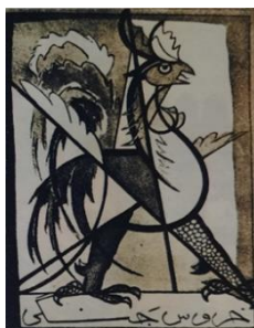
تصویر ۱. طرح روی جلد مجله خروس جنگی؛ اثر جلیل ضیاءپور، ۱۳۲۸ (منبع: خروس جنگی، شماره یکم)