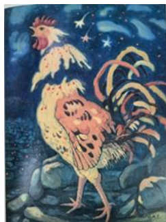
تصویر ۲. آواز خروس، اثر عبدالله عامری، ۱۳۳۰ (منبع: مجابی، ۱۳۷۶، ص. ۲۰۸)