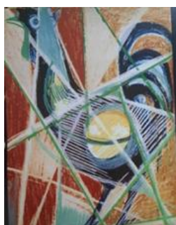
تصویر ۳. خروس؛ محتملاً اواسط دهه سی شمسی، اثر هوشنگ پزشک‌نیا (منبع: ملکی، ۱۳۹۶: ۲۶)