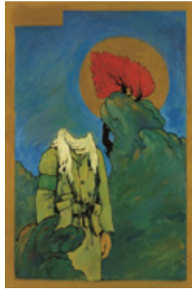
تصویر ۲. شهادت، تکنیک: رنگ و روغن، ۱۳۶۴، هنرمند: علی وزیریان (URL2).