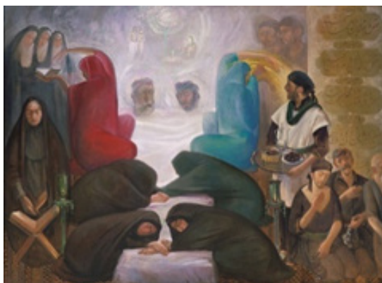
تصویر ۱۰. عزاداری، تکنیک: رنگ و روغن، ۱۳۶۳، هنرمند: کاظم چلیپا (گودرزی، ۱۳۸۸: ۱۲۷)