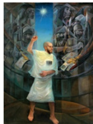
تصویر ۱۳. رمی جمرات، تکنیک: رنگ و روغن، ۱۳۶۲، هنرمند: حبیب‌الله صادقی (گودرزی، ۱۳۸۷)