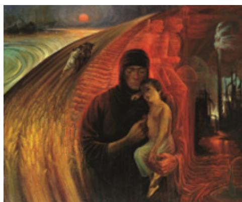
تصویر ۹. مقاومت، تکنیک: رنگ و روغن، ۱۳۶۲، هنرمند: حبیب‌الله صادقی (گودرزی، ۱۳۸۸: ۱۰۳)