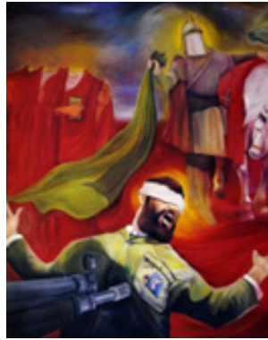
تصویر ۵. شهادت، تکنیک: رنگ و روغن، ۱۳۵۸، هنرمند: حبیب‌الله صادقی (گودرزی، ۱۳۸۸: ۹۵)