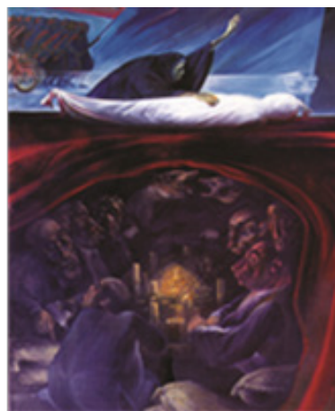
تصویر ۷. موش‌های سکه‌خوار، تکنیک: رنگ و روغن، ۱۳۶۲، هنرمند: کاظم چلیپا (گودرزی، ۱۳۸۷: ۹)