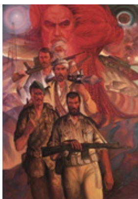
تصویر ۱۵. مرزبانان دشت شقایق، تکنیک: رنگ و روغن، ۱۳۵۹، هنرمند: کاظم چلیپا، (URL2)