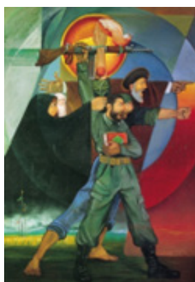
تصویر ۱۷. همسگران قدس، تکنیک: رنگ و روغن، ۱۳۶۳، هنرمند: حسین خسروجردی، (URL2)