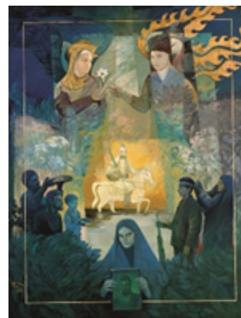
تصویر ۱۱. انقلاب اسلامی، تکنیک: رنگ و روغن، ۱۳۶۲، هنرمند: ایرج اسکندری (گودرزی، ۱۳۸۸: ۶۵)