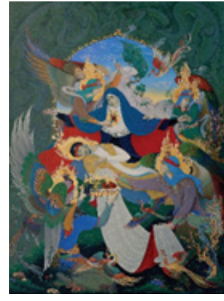
تصویر ۱. معراج شهید، تکنیک: گواش، ۱۳۶۷، هنرمند: محمدعلی رجبی (گودرزی، ۱۳۸۸: ۱۳۵)