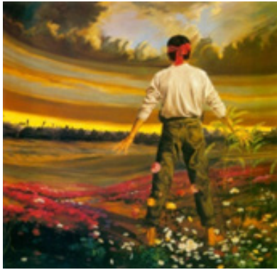
تصویر ۶. شهادت، تکنیک: رنگ و روغن، ۱۳۶۰، هنرمند: مصطفی گودرزی (URL2)