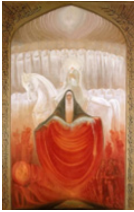
تصویر ۳. اینثار، تکنیک: رنگ و روغن، ۱۳۶۰، هنرمند: کاظم چلیپا (گودرزی، ۱۳۸۸: ۱۰۵)