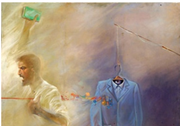
تصویر ۱۲. هرگز مباد، تکنیک: رنگ و روغن، ۱۳۶۴، هنرمند: حبیب‌الله صادقی (گودرزی، ۱۳۸۸: ۲۰۹)