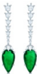
تصویر ۵. گوشواره

با توجه به این امر، در تصاویر زیورآلات با سه نوع گفتار مواجهیم. نخست، گفتار مستقیم که به بیان