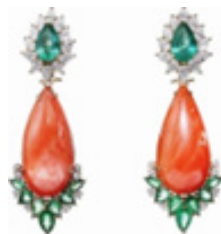
تصویر ۲. زیور گوش

تصویر ۱ و ۲. زیور گوش اثر فرح‌خان علی؛ از موفق‌ترین طراحان زیورآلات در هندوستان است و همواره ستارگان سینمای بالیوود به او توجه نشان داده‌اند؛ اغلب آثار او، قطعات محدودی که به ندرت تکرار می‌شوند.