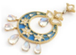
تصویر ۴. زیور گوش