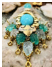
تصویر ۱. زیور گوش

تصویر و معنای متنی به‌دست نمی‌آید. درنهایت فرض اصلی گفتگومندی بر این است که هیچ چیز قابل ادراک‌شدنی نیست، مگر در چشم‌انداز چیزی دیگر؛ «گفتگو بدون تعامل با دیگران، بدون قرار گرفتن و در معرض صدای دیگران بودن شکل نمی‌گیرد. هر آنچه گفته می‌شود، انعکاس صدای دیگری است در مکالمه» (پنجه‌باشی، ۱۳۹۹: ۷۷). آنچه در این ارتباط اثرگذار است همانا حضور «دیگری» است که «دریچه‌ای به جهانی دارد که من هرگز در آن زندگی نمی‌کنم» (هینز، ۱۴۰۰: ۹۱). اینکه چگونه هنرمندی دست به آفرینش اثری می‌زند و چگونه مخاطب، معنای آن‌ها را دریافت و تفسیر می‌کند، با توجه به وجود «دیگری» ضبط و درک می‌شود. گفتگومندی فراتر از یک ارتباط صرف است و یک ایده کلیدی از روابط اجتماعی به شمار می‌آید. اکنون اگر فرض کنیم اجتماع نباشد، واقعیتی هم وجود نخواهد داشت.