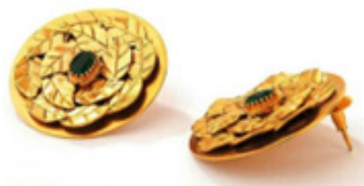
تصویر ۳. گوشواره.

تصویر ۳. گوشواره اثر سوهانی پیتی ۱۵ ؛ این هنرمند یکی دیگر از طراحان برجسته هند است که در اغلب نشریات مُد، از او به‌عنوان طراح زیورآلات خلاق یاد شده و آثارش همواره توجه ستارگان بالیوود را نیز برانگیخته است.