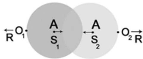
تصویر ۷. بازنمایی شماتیک گفتگومندی براساس نظریه باختین