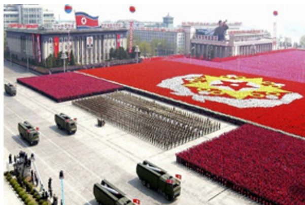
تصویر ۶. تصویر سمت چپ عظمت و قدرت ارتش کره شمالی را نشان می‌دهد و تصویر سمت راست رنج مردم کره شمالی (Mark, 2020)

https://www.businessinsider.com/north-korea-secret-photos-2018-3