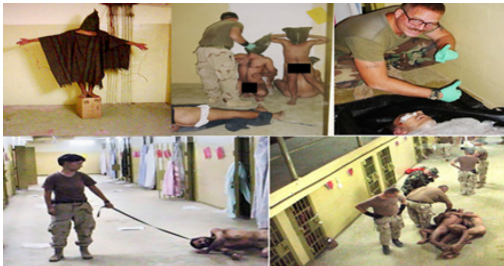
تصویر ۳. تصاویر شکنجه زندانی‌های اسلام‌گرا در زندان‌های مخفی توسط اعضای سی. آی. ای و ارتش ایالات متحده (Kinderman, 2006)

https://www.psychliverpool.co.uk/psychology-news/social/abu-ghraib-real-stanford-prison-experiment