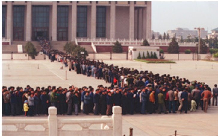
تصویر ۷. ادای احترام چینی‌ها به مائو در آرامگاهش در سالروز انقلاب خلق چین (Bleiker, 2018b)

افراد با حداکثر تأثیرات تصویری و دیداری طراحی شده است. هدف اساسی این تصاویر گسترش جهانی ادراک ترس است. در نظر بگیریید که چگونه تصاویر و ابداعات بصری باعث تجسم عملکردی می‌شوند و از نظر سیاسی حس هویت و اجتماع بودن را تقویت می‌کنند. پرچم‌ها، رژه‌ها، نمادهای مذهبی، بناهای تاریخی و مقبره‌ها بارزترین نمونه‌ها هستند (Rolling, 2007: 8). به آرامگاه