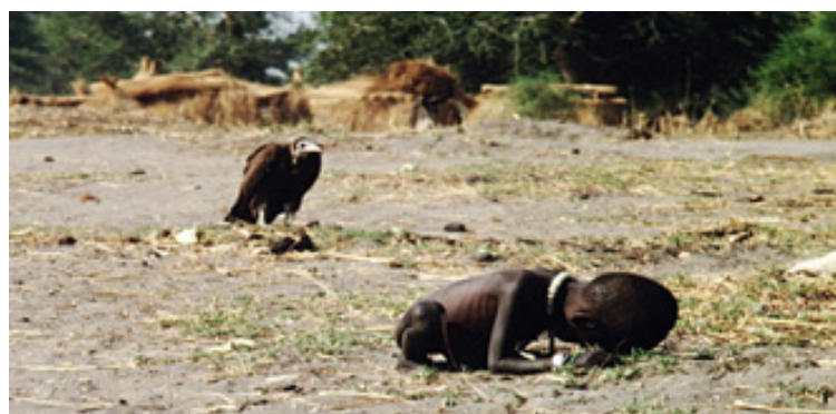
تصویر ۵- عکس کوین کارتر برنده جایزه پولیتزر در سال ۱۹۹۴

در بحث تجزیه و تحلیل و واکاوی ماهیت سیاسی تصاویر و ابداعات بصری، نوعی روش‌شناسی ترکیبی سیاسی و تحلیل وجود دارد. این روش‌شناسی ترکیبی سه