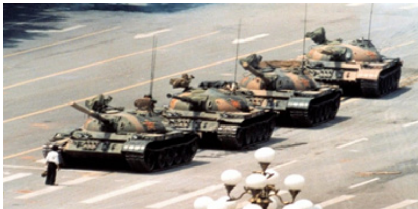
تصویر ۱. مرد معترض در میدان تیانمن در برابر رژه ارتش جمهوری خلق چین منبع: (Beaumont, 2019)

https://www.theguardian.com/world/2019/may/11/tank-man-photograph-tiananmen-square-30-years-jeff-widener