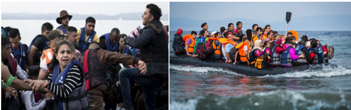
تصویر ۴. مهاجران خاورمیانه‌ای عازم استرالیا

مرحله اساسی را در ادراک سیاسی و زیبایی‌شناختی ابداعات بصری از جمله تصاویر و ارتباط آن با ساخت‌بندی مفهومی سیاست داخلی و جهانی مشخص کرده است. این سه مرحله می‌توانند ادراک مفهومی و سیاسی تصاویر را تسهیل یا دشوار کنند. این سه مرحله عبارتند از: