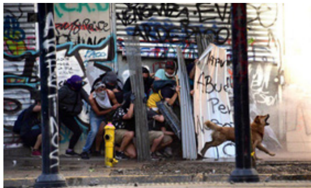
تصویر ۲. سگ معروف اعتراضات سال ۲۰۱۹ کشور شیلی منبع: (Almaraz, 2019)

https://news.culturacolectiva.com/mundo/rucio-capucha-las-imagenes-del-perrito-manifestante-en-chile