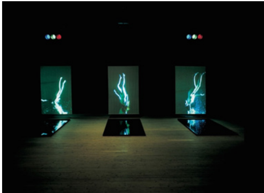
تصویر ۵. بیل ویولا، فرستاده، ۱۹۹۶

و یا غزل معروف: مرده بدم زنده شدم گریه بدم خنده شدم دولت عشق آمد و من دولت پاینده شدم (مولوی، کلیات شمس تبریزی، ۱۳۹۳).