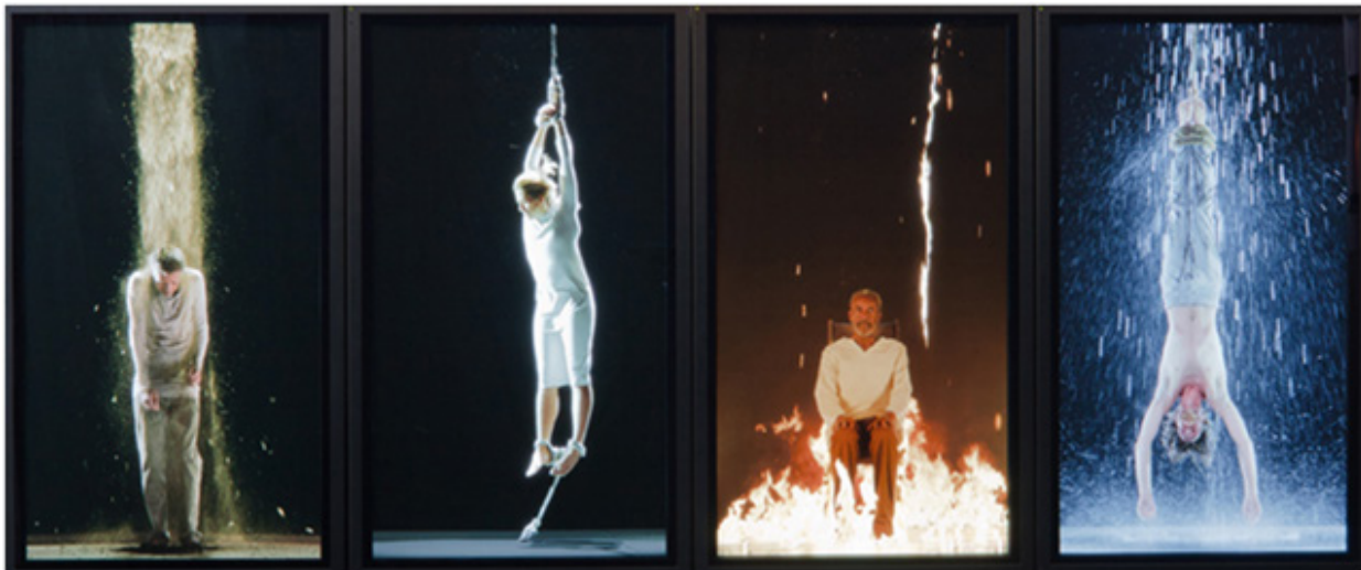
تصویر ۲. بیل ویولا، شهنا، ۲۰۱۴ مأخذ: ( https://www.dximagazine.com )

دفن شده» ۳۱ برای نمایشگاه آثار ویدئویی ویولا در چهل و هشتمین دوسالانه ونیز در غرفه آمریکا بود، می‌تواند مدخلی باشد برای واکاوی و بن‌گیری خط فکری ویولا: