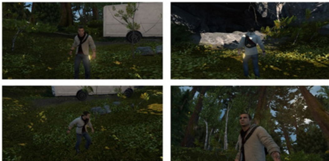
شکل ۳- نماهایی مختلف از بازی کیش حشاشین ۳ (یوبی سافت، ۲۰۱۲).

خیالی خود هستند که به شکل بلادرنگ و خودمختار عمل می کنند. چنانکه بیان شد در ایجاد پیکره های گرافیکی رایانه ای موجود در پویا نمایی و عروسک ها، شباهت های چشمگیری وجود دارد: ایجاد هر دو شامل ساختن یک پیکره دارای نقاط مفصل بندی است که به آن ویژگی های طراحی سطح داده می شود. تفاوت میان پیکره های موجود در پویانمایی با عروسک ها و آواتارها در فاصله موجود میان اجرا تا نمایش است. در حالیکه آواتارها و عروسک ها به شکل بلادرنگ با مخاطب ارتباط برقرار می کنند در پویانمایی و در فناوری ضبط- حرکت، به فاصله میان تولید تا نمایش برای اصلاحات نیاز است.