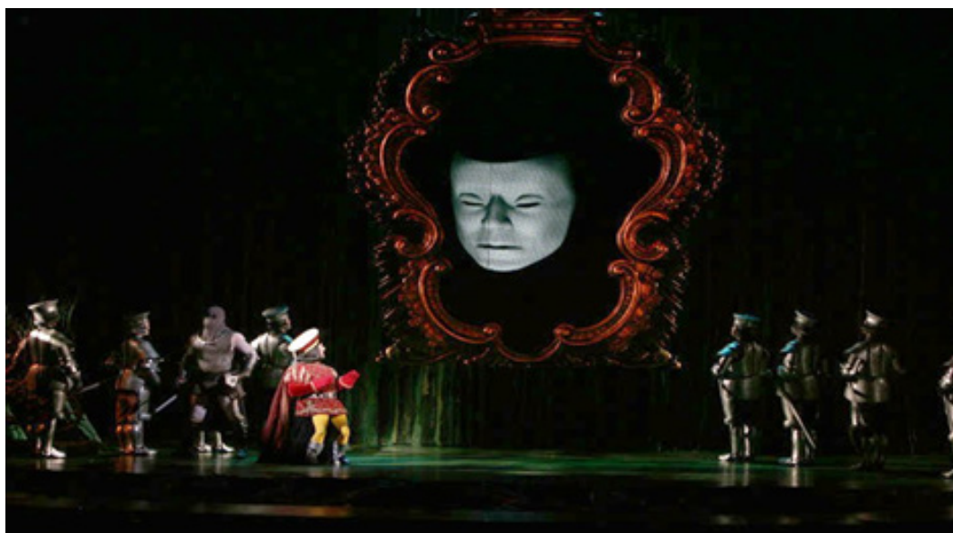
شکل ۲. کاربرد عروسک گردانی دیجیتال - اجرایی از تئاتر شرک در سال ۲۰۰۸ میلادی در برادوی که نقش آینه جادویی توسط عروسک دیجیتال انجام شده است، (منبع: نگارندگان). Hatley, Tim (2008). "Shrek the Musical". Retrieved from http://www.souvenir.co.uk/?cat=1 (access date: 05/12/2020)