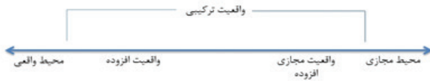
تصویر ۴. پیوستار واقعیت-مجازیت میلیگرام.

اشیاء افزوده شده توسط کامپیوتر نیز می‌پردازد. برای اینکه همزیستی میان اشیاء واقعی و اشیاء افزوده شده توسط تکنولوژی نشان داده شود باید نشان داد که امکان خلق دو دنیای متفاوت که هر دو توسط سوژه مدرک شکل می‌گیرد امکان‌پذیر نیست. در درک ایماژ تصویری، یک سوژه دوم در تصویر ایجاد می‌شود و این سوژه دوم با ادراک اشیاء، چنانکه گویی اشیاء واقعی هستند، زیست می‌کند. این مطلب را هوسرل با لفظ Hineinsehen یاد می‌کند، که منظور از آن نه تنها این است که کسی چیزی را در تصویر می‌بیند بلکه این نیز هست که انسان وقتی تصویری را می‌بیند خود را درون آن احساس می‌کند. در اینجا باید توجه کرد که سوژه دوم در دنیای دیگری به وجود می‌آید و این سوژه دوم مبتنی بر سوژه اول و وابسته به آن است (شکل ۱).