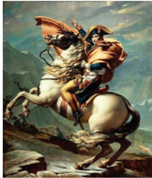
تصویر ۱. پرتره ناپلئون بناپارت. مأخذ: (درگاه ویکی مدیا، تاریخ دسترسی: ۱۵/۲۰/۱۰/۱۰)

در اینجا ادراک از ایجاد تضادها میان سطوح بدست می‌آید. تصویر فیزیکی با تصویر- اُبژه تضاد به وجود می‌آورد از آن رو که در یک مکان- زمان مفاهیم متفاوتی را به سوژه عرضه می‌کند. در حالی که تصویر فیزیکی بوم را تبدیل به یک شیء فیزیکی می‌کند که بدون در نظر گرفتن محتوایش تنها چیزی است که از دیوار آویخته شده است، تصویر- اُبژه با تأکید بر صحنه امر دیگری را بیان می‌کند. به عنوان مثال وقتی بیننده به تابلوی پرتره ناپلئون بناپارت می‌نگرد مقدار زیادی رنگ قرمز و سفید را بر بوم می‌بیند (تصویر فیزیکی) و درست در همین زمان و همین مکان بیننده تصویر ناپلئون را بر اسبش شناسایی می‌کند (تصویر- اُبژه) و این دو منظر با هم برخورد می‌کنند (تصویر ۱).