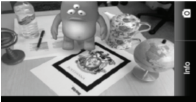
تصویر ۲. نمای گرفته شده از صفحه نمایش تلفن همراه آیفون نشان دهنده حضور پروتو موجود مجازی ساخته شده توسط Boffswana Company در محیط واقعی کاربر. مأخذ: (Geroimenko, 2012:452)