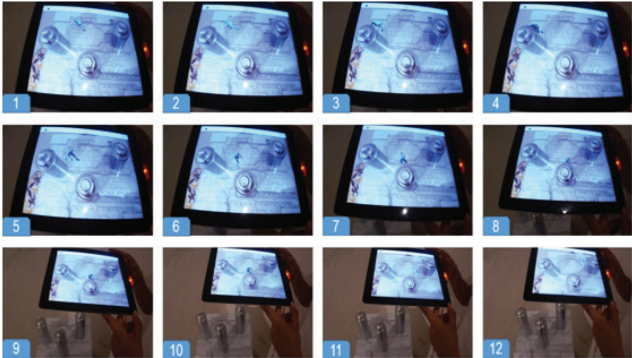
تصویر ۵. تحلیل تضاد تصویر فیزیکی و تصویر اَبژه اثر هنری واقعیت افزوده اثربشوع ابراهیم (۲۰۱۴). مریدا، مکزیک.

کامپیوتری بر اشیاء دنیای واقعی به صورت سه بُعدی و تعاملی است. هنر واقعیت افزوده که از این تکنولوژی به عنوان رسانه خود استفاده می‌کند، هنری است دیجیتال، تعاملی و متحرک. این هنر محدود به زمان و مکان نبوده و هزینه تولید پایینی دارد. علاوه بر این همچون دیگر هنرهایی که در سطح عمومی ارائه می‌شوند، قابل جمع‌آوری و آسیب‌پذیری توسط نهادها و افراد نیست. این هنر به لحاظ ماهیت خود آغازگر یک پارادایم جدید هنری خواهد بود.