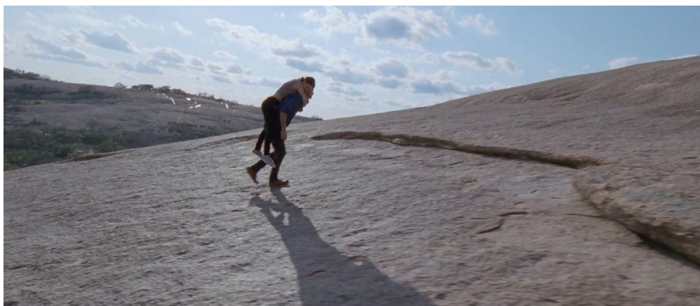
تصویر ۲: فی و بی‌وی در بازگشت به طبیعت

بی‌وی دنیای موسیقی را ترک کرده و به خانه پدری بازگشته و فی هم به او می‌پیوندد. فی از طریق مشاوره‌های یک زن موسیقیدان و بی‌وی از طریق مواجهه با پدر زمین‌گیرش، هدفی برای ترمیم رابطه و بازقلمروگذاری میل رهاشده پیدا کرده‌اند. بی‌وی برای امرار معاش کارگر حفاری شده و صوت ذهنی فی از صلح و بخشش می‌گوید. در نماهای پایانی دوربین با حرکات آرام و سرگردان در فضا حضور دارد و تمرکزش از چهره‌ها به دست‌هایی که آب و پوست را لمس می‌کنند یا عناصر طبیعت معطوف می‌شود. در بسیاری از نماها که بخشی از بدن شخصیت‌ها در سکوت قاب دیده می‌شود، عناصر عینی (آب، خاک، نور) و اجزای بدن انسان ارزش بصری مساوی دارند. فضای آرام و نورانی طبیعت در نماهای پایانی، سوژه انسانی را در محیط نامتمرکز می‌کند و شخصیت‌ها را در قلمروی حسی قرار می‌دهد. در این میزانسن بدن‌ها به‌جای نمایش یک ساختار زبانی، الگویی از حرکت آزادانه و کاتوتیک بین عین (طبیعت) و ذهن، یا چگونگی یادآوری خاطره را بازتاب می‌دهند. صدای فی که به دنیای درونی و خاطرات حسی او متصل است، گاه در تضاد، گاه به موازات و گاه بی‌هیچ پیوندی با تصاویر شنیده می‌شود و ما به‌طور هم‌زمان شاهد قلمروهای زمان حال و خاطره‌ای هستیم که در ابتدای فیلم توسط آژانسمان تدوینی به آینده پرتاب شده بود.