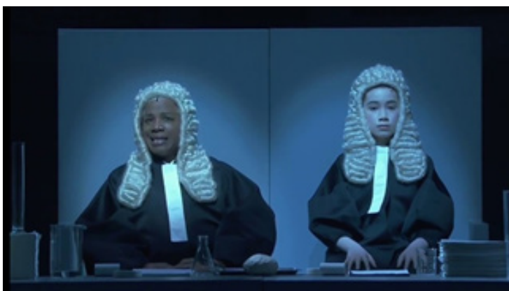
تصویر ۳: اینشتین در ساحل. محاکمه ۱

شکل دیگری از نی پلی یک، دو زن سیاه پوست و سفید پوست عقب صحنه هستند. در همان مربع سفید و روشن‌شان. اما این بار پشت‌شان به تماشاگران است. چهره گروه کر روشن می‌شود. طوری که انگار در نقطه شروع نمایش هستیم.