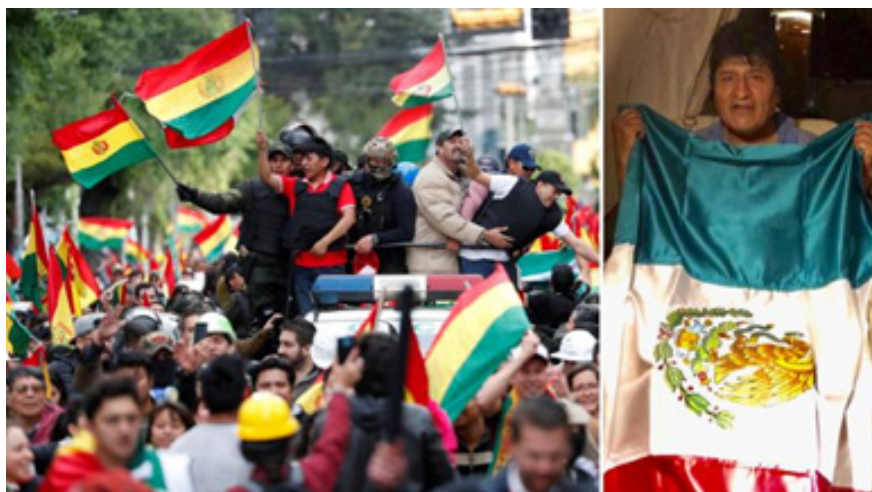
تصویر ۸. شورش‌های سال ۲۰۱۹ در بولیوی و فرار رئیس جمهوری این کشور به مکزیک