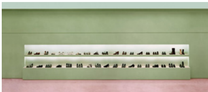
تصویر ۲: آندریاس گورسکی، مجموعه پرادا، ۱۹۹۶

می‌توان این‌گونه بیان داشت که عکس بازار بورس با دیدگاه بیردزلی همخوانی دارد و می‌تواند اثر خوبی باشد، زیرا دارای ارزش زیباشناختی است، که هم خصوصیات فرمال و هم خصوصیات بیانی را شامل می‌شود و تجربه زیباشناختی را موجب می‌شود. به عبارتی این عکس در نقطه دیدی قرار گرفته است که ما صحنه را به صورت کل واحدی از اجزای می‌بینیم و