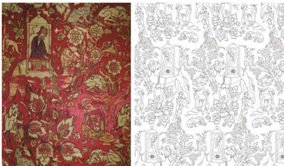
تصویر ۱. پارچه مخمل در مجموعه کلکیان http://digitalcommons.unl.edu

خویش است. لیلی بر کجاوهای که شتری آن را حمل می‌کند، به دیدار مجنون آمده است. پارچه زیر کجاوه خشک و بدون چین و شکن تصویر شده است، لیلی لباس و سرپوشی به سبک زنان مکتب تبریز بر تن دارد. حضورش تأثیری بر مجنون ندارد زیرا مجنون غرق در تفکر است و گویی در این عالم نیست. رفتار و وقار لیلی به شخصیت‌های نگاره‌ای صفوی شباهت دارد. زمینه اثر با درختچه‌هایی که برگ‌های درشتی دارند به همراه گل‌های شاه‌عباسی پُر شده است. حضور پرنده‌ای نشست بر آن‌ها بازگو کننده درختی در باغ رویایی است.