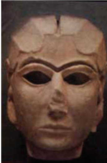
۵ یکی از الهگان سومر، به دست آمده از اور، ۳۰۰۰-۳۵۰۰ پیش از میلاد، موزه عراق، بغداد: یکی از نمونه‌های هنر بین‌النهرین؛