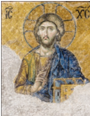
۸ معروف‌ترین قطعه معرق‌کاری بر جا مانده از دوران بیزانس در کلیسای ایاصوفیه استانبول از «مسیح توانا»، قرن دوازدهم میلادی: نمونه‌ای از شمایل‌نگاری مذهبی بیزانس