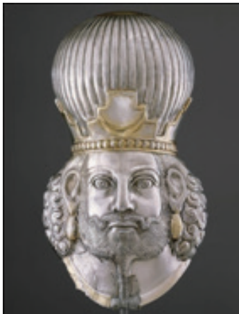
۷ تندیس شاپور دوم ساسانی، از نقره طلاکاری شده، قرن چهارم میلادی، به طول ۴۰ سانتی‌متر، موزه متروپولیتن؛