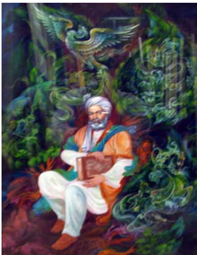
۸. اثر پرویز جاسبی شاهنامه فرهنگستان بسی رنج بردم در این سال سی