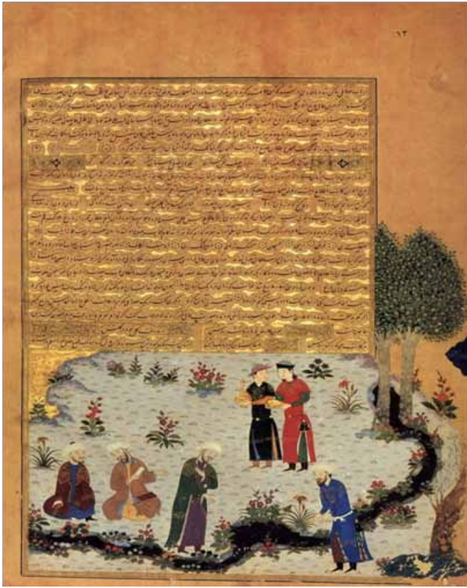
۱. نگاره شاهنامه بایسنقری