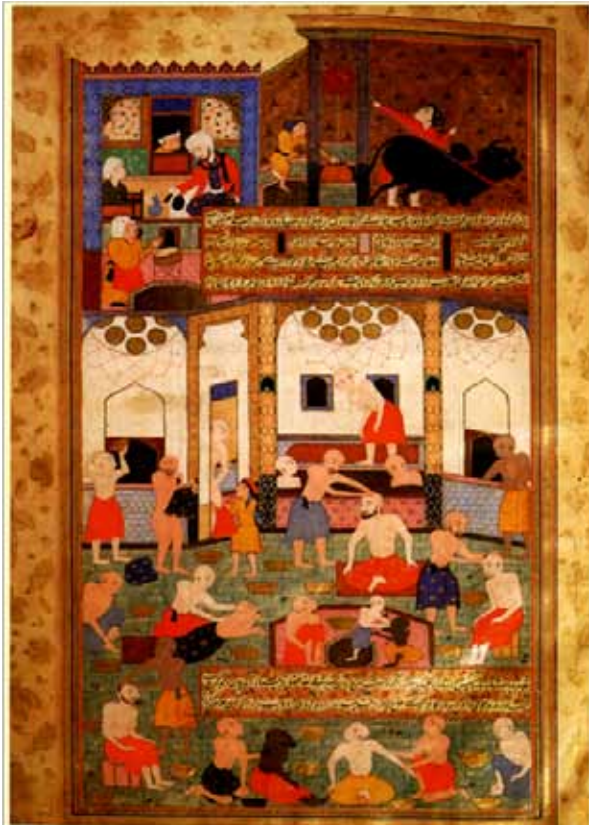
۵. شاهنامه قوام مجلس سوم: فردوسی در حمام