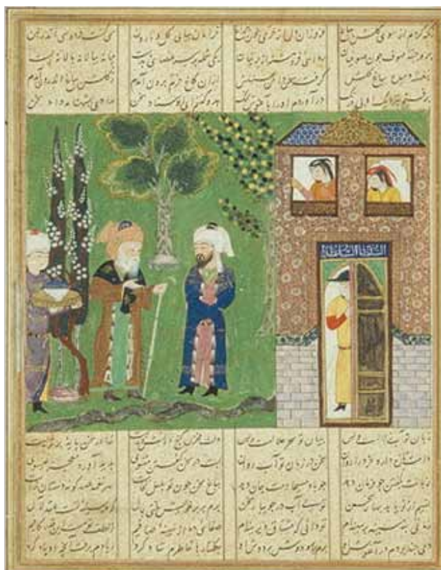
۷. خاوران نامه ملاقات فردوسی و ابن حسام