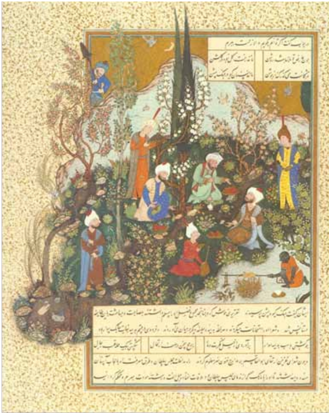
۲. نگاره شاهنامه شاه پهماسپی