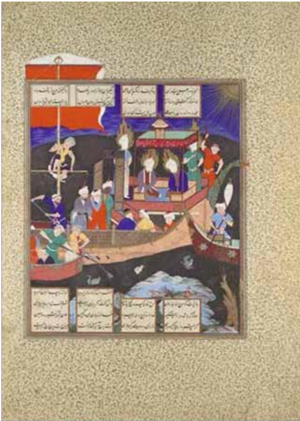
۶. شاهنامه شاه طهماسبی کشتی تشیع