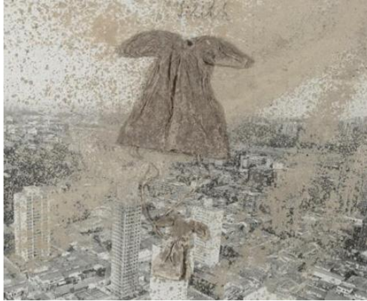
تصویر ۱۰: آنسلم کیفر، لیلیت (۱۹۹۰)، مجموعه خصوصی هنرمند

2009, p. 12). کیفر، ابتدا با این اثر و بعد از آن با نقاشی‌هایی که در آن نمادها و فضاهای تاریخی و اسطوره‌های ملی آلمان حضور داشتند، به مضامین فاشیسم و هولوکاست پرداخت. «کار او، هم‌نسلاش را از رویاها و کابوس‌های‌شان بیدار کرد و تداعی‌های جنگ و وحشت را با احساس تجربه‌ای واقعی - هرچند قدیمی - در آمیخت» (Trommler, 1989, p. 730).