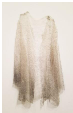
تصویر ۶: دوریس سالسدو، به یاد نیورد (۲۰۱۴)، گالری مکعب سفید، لندن

یک پرده شیری‌رنگ بین چشم بیننده و کفش‌های پوشیده‌شده می‌کشد (تصویر ۷). سالسدو در این اثر، با استفاده از نخ جراحی که می‌تواند استعاره‌ای از کالبدشکافی اجساد باشد، تلاش می‌کند هویت قربانی و بلایی که بر سر او آمده را نمایان کند. پوسته احشایی روی کفش‌ها، که با فشار کفش‌ها را پوشانده، به دلیل ماهیت نرم و شفافش، مرزهای بیرون و درون تابوت را کاملاً از هم جدا نمی‌کند. در انگاره خلق شده در این اثر، مرزهای میان زندگی و مرگ مبهم می‌شوند و مخاطب از اثر حسی تهدیدآمیز دریافت می‌کند و خود را قربانی بعدی تصور می‌کند. سالسدو می‌گوید «خشونت و وحشت، شما را مجبور می‌کند به «دیگری» توجه کنید و رنج او را ببینید» (Basualdo et al., 2000, p. 14).