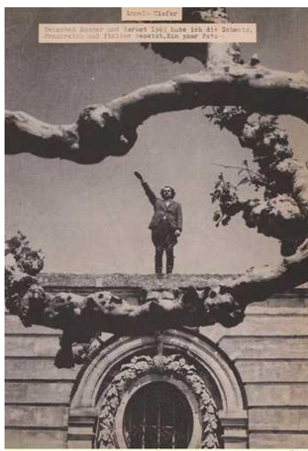
تصویر ۹: آنسلم کیفر، اشغال (۱۹۶۹)، آنسلم کیفر، منتشر شده در شماره ۱۲ نشریه آنتیفانگشین، ۱۹۷۵

یکی دیگر از هنرمندانی که از لباس در آثارش استفاده کرده است آنسلم کیفر است. وی با این‌که، مثل بولتانسکی، تجربه مستقیمی از جنگ ندارد، نگرش و دیدگاه‌هایش بسیار متفاوت از اوست. کیفر در آلمانی رشد کرد که گذشته‌اش در سکوت و انکار و نوعی فراموشی خودخواسته غرق شده بود. گذشته آلمان همانند یک آبه‌ه، در خارج از مرزها قرار گرفت تا جامعه پس از جنگ آلمان از ناامنی و شرم حاصل از آن دور نگه داشته شود. اما کیفر به عنوان یک هنرمند آلمانی، در دوران پساجنگ و پسا‌هولوکاست، این مرزها را می‌شکند، زیرا عقیده دارد باید با این گذشته شرم‌آور روبرو شد.