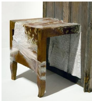
تصویر ۴: دوریس سالسدو، خانه بیوه I (۱۹۹۲-۴)، جزئیات، موزه هنرهای معاصر شیکاگو

این شیوه به طور مشابه در بیشتر آثار سالسدو که از ترکیب لباس با اثاتیۀ منزل ایجاد شده است دیده می‌شود. او از تکنیک‌های مشابهی در سری خانه بیوه ۴ (۱۹۹۲-۵) استفاده کرده است (تصویر ۴). در این آثار نیز لباس به عنوان استعاره‌ای از بدن قربانیان در این اقلام کم و بیش مبلمان مانند جاسازی و محصور شده‌اند. «خانه که سرپناهی برای محافظت و پناه دادن ساکنانش است، با خشونت به آرامگاه و محل دفن آنها بدل می‌شود» (Merewether, 2008, p. 40).