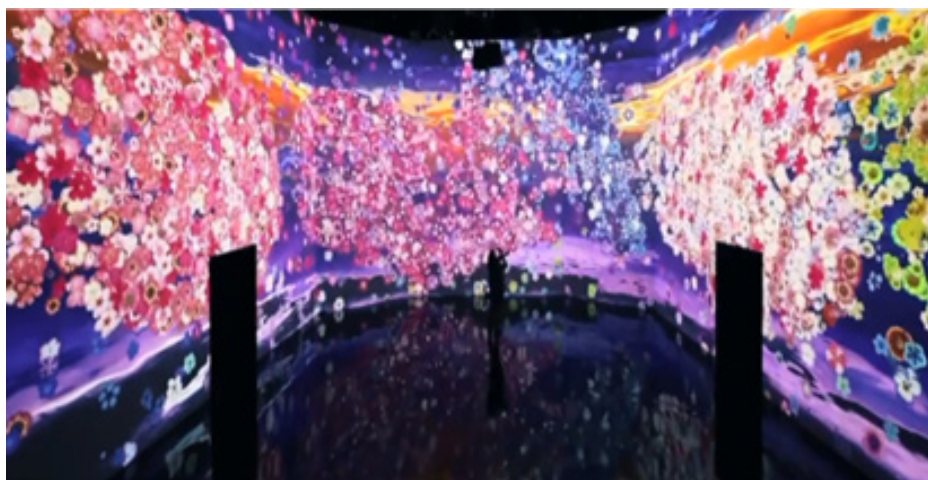
تصویر ۳. چیدمان شکوفه‌ها، گالری هنری Artech House

از سواحل مدیترانه و فرم‌های ابسترکتی را با نقاشی و جوهر خلق کند که تداعی‌گر ارتباط میکرو و ماکرو ۱۵ هستند. در چیدمان توهم وجود مؤلفه‌هایی همچون تخیل، درهم‌آمیختگی عناصر متفاوت و متضاد، به‌کارگیری مجموعه حواس و درنهایت تکثیر نشانه‌های بدون ارجاع واقعی، فضایی فراواقعی را برای مخاطب ایجاد می‌کند. همه این موارد منطبق با نظرات بودریار است که می‌گوید، در دوره پسامدرن ایماژ و بازی نشانه‌ها که حاصل فناوری در جامعه معاصر است. مؤلفه‌هایی هستند که چیزی جز غیاب واقعیت را بیان نمی‌کنند و حامل هیچ‌گونه ارتباطی با واقعیت نیز نیستند. «نشانه‌ها مرجع یا مصداق ندارند و نشانه‌های تهی بی‌معنا، معناباحته و گنگ ما را در خود مستحیل می‌کنند» (Baudrillard, 1990: 74).