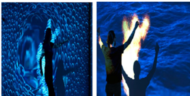
تصویر ۴. چیدمان توهم گالری Flutter Experience