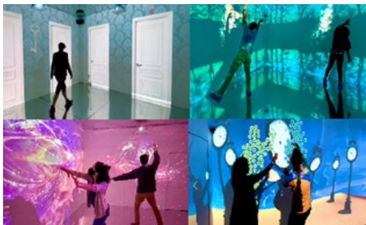
تصویر ۵. چیدمان گریز رویاها، گالری Flutter Experience