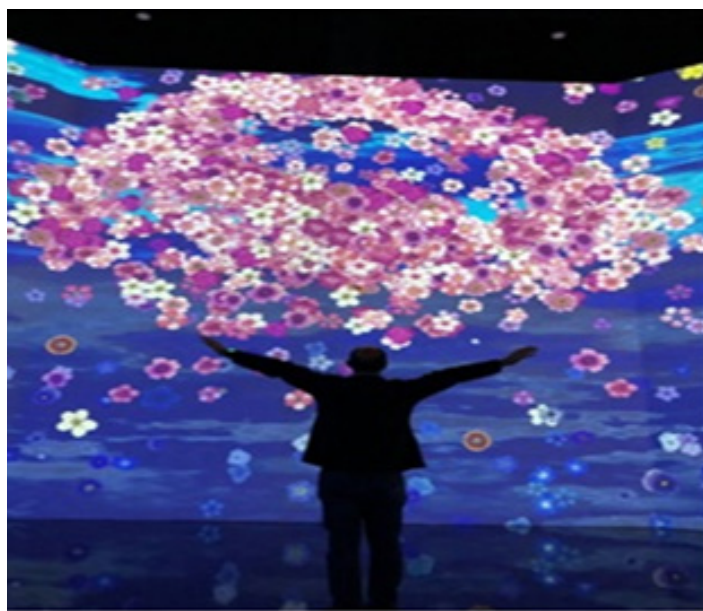
تصویر ۲. چیدمان شکوفه‌ها، گالری هنری Artech House

چیدمان شکوفه‌های گیلاس وجود مؤلفه‌هایی همچون تعامل هوشمندانه با مخاطب، معکوس کردن ترتیب علت و معلولی امر واقعی، به‌کارگیری ابعاد واقعی و ایجاد حس وجود جهان موازی و در نهایت ترکیب این مؤلفه‌ها در اثر، وجود دنیای فراواقعی را برای مخاطب باورپذیر می‌کند.