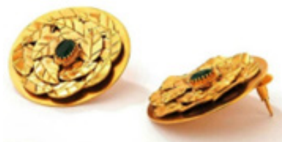
تصویر ۳. گوشواره.

تصویر ۳. گوشواره اثر سوهانی پیتی ۱۵ ؛ این هنرمند یکی دیگر از طراحان برجسته هند است که در اغلب نشریات مُد، از او به‌عنوان طراح زیورآلات خلاق یاد شده و آثارش همواره توجه ستارگان بالیوود را نیز برانگیخته است.