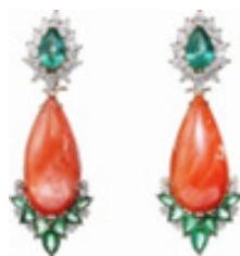
تصویر ۲. زیور گوش