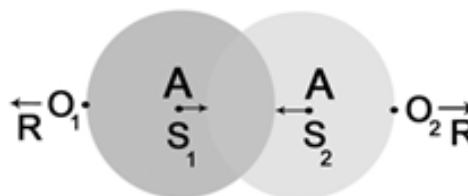
تصویر ۷. بازنمایی شماتیک گفتگومندی براساس نظریه باختین