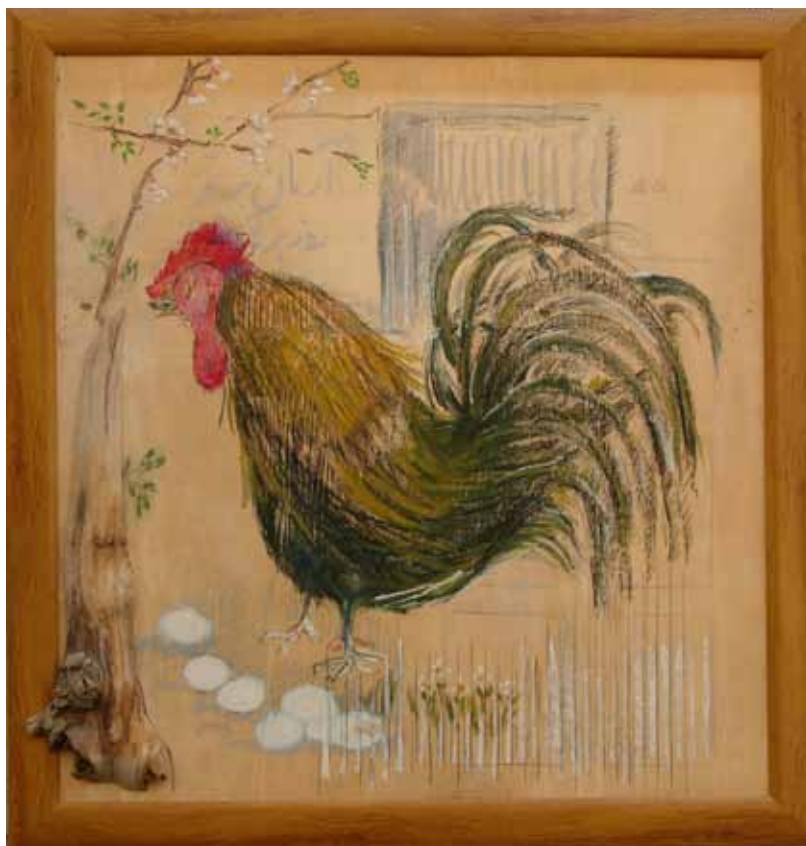
۷ فرشته غازی‌راد، حیرانی خروس، پاستل روی چوب ۱۰۷۰×۱۰۰۰ مم، ۱۳۸۴، مجموعه خصوصی، تهران