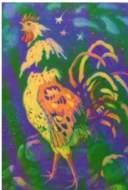
پابلو پیکاسو، خروس، پاستل رنگی روی مقوا، ۱۹۳۸، ۵۴۰×۷۷۵ مم، مجموعه کالین، نیویورک