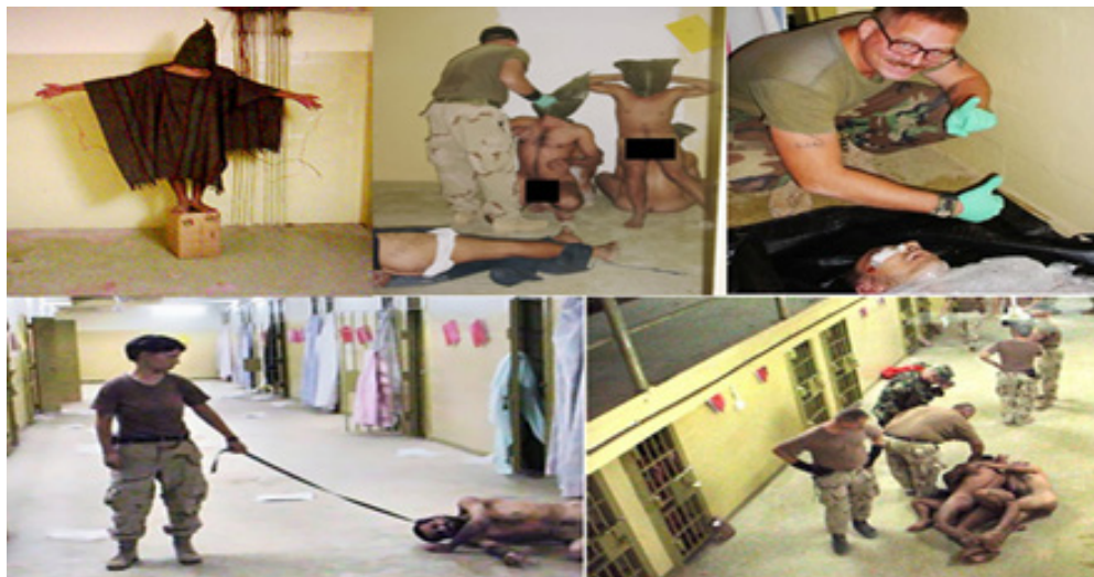
تصویر ۳. تصاویر شکنجه زندانی‌های اسلام‌گرا در زندان‌های مخفی توسط اعضای سی. آی. ای و ارتش ایالات متحده (Kinderman, 2006)

https://www.psychliverpool.co.uk/psychology-news/social/abu-ghraib-real-stanford-prison-experiment