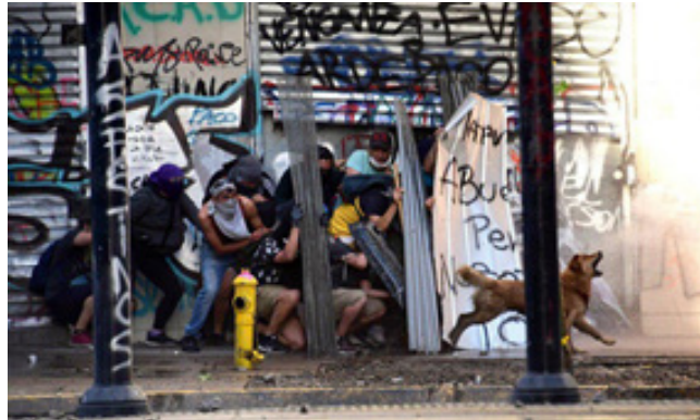
تصویر ۲. سگ معروف اعتراضات سال ۲۰۱۹ کشور شیلی

گزارش‌های برای آنها سانسور شده است، اصولاً دانش ضروری و پیش‌زمینه‌ای را برای تفسیر این عکس ندارند چه رسد به اینکه آن را به‌عنوان یک نماد تشخیص دهند. به تصویر زیر نیز دقت کنید. این تصویر مربوط به اعتراضات در کشور شیلی است. نگاه بیننده مطلع و غیر مطلع از تحولات شیلی به این ابداع بصری ادراکات متفاوتی را در ذهن وی شکل می‌دهد. این عکس جنبه غیر کلامی و احساسی زیادی را در مطبوعات دنیا برانگیخته است. عکس مورد نظر، مخالفان دولت شیلی را در کنار سگی که همراه با معترضان و در دفاع از آنها، به پلیس ضد شورش حمله می‌کند را نشان می‌دهد. این سگ به سمبل اعتراضات و مقاومت و همبستگی در بین معترضان تبدیل شده است.